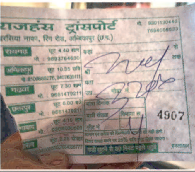
जाना अम्बिकापुर तक था पर रायगढ़ तक का दिया गया किराया

बस मालिक परमिट लेकर बसों का संचालन नहीं कर रहे हैं, नियमों के तहत जिस राज्य का बस मालिक निवासी है वही उसे राज्य की रिक्तियां ले सकता है लेकिन बैतूल और उसके भांजे तीनों राज्य से परमिट लिए हुए हैं और छत्तीसगढ़ सरकार से बाकायदा काउंटर साइन भी करते हैं जबकि वे सभी काली छया पड़ी हुई है यही कारण है कि इस मार्ग पर अपना एक छत्र राज स्थापित कर रखा है यात्रियों से बसदल्लू की मनमानी किराया वसूली और कभी भी कहीं पर भी बसों को खड़ा कर यात्रियों से बदतमीजी करने का सिलसिला अभी खत्म नहीं हुआ है और छत्तीसगढ़ से भी लगभग रिक्तियों पर इसका कब्जा है, वही बिहार राज्य की रिक्तियां पर भी यही