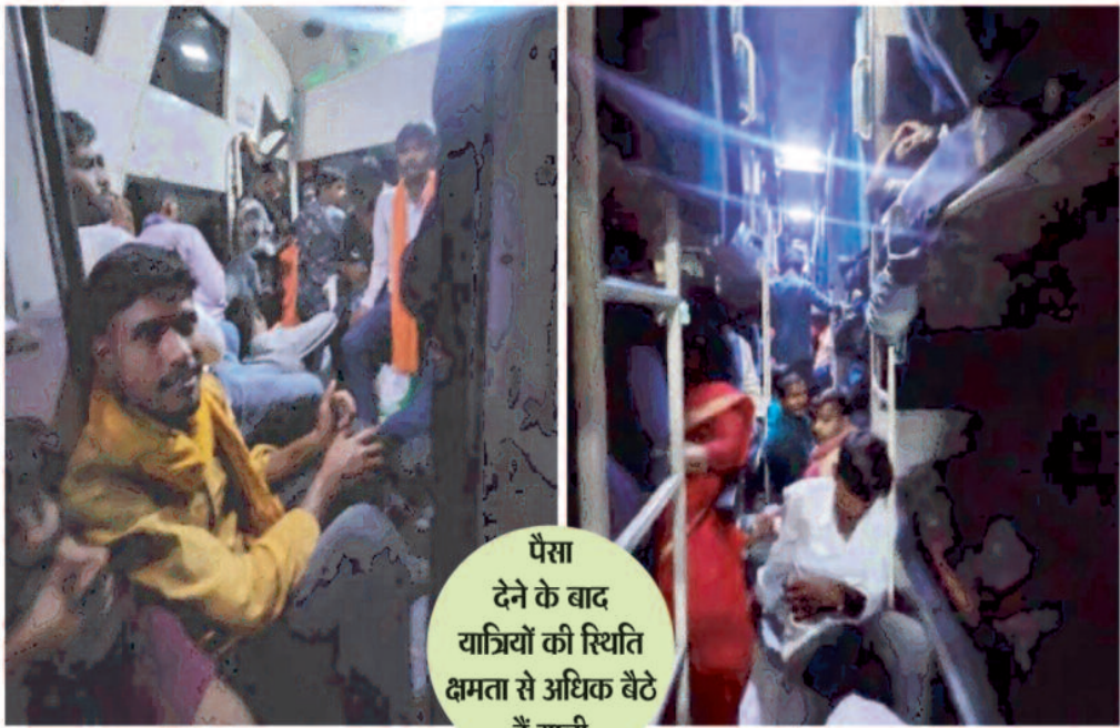
पैसा देने के बाद यात्रियों की स्थिति क्षमता से अधिक बैठे हैं यात्री

हैं क्योंकि जबदस्ती ही उनसे किराया वसूली की जाती है किराया का दर सूची का पता नहीं जिसे जो पाया जैसे पाया जितना अधिक ले सकते हैं यात्रियों से किराया लेकर उन्हें लूट रहे हैं, यदि यात्री को जाना है अम्बिकापुर तो रायगढ़ तक का किराया लिया जाता है, नहीं तो सीट देने से इनकार किया जाता है, रोज नोक शोक की स्थिति निर्मित होती है पर जिम्मेदार अधिकारी कभी भी उसे बस स्टैंड पर जाकर यात्रियों के साथ नियम से अधिक किराया लेने की जांच नहीं करते हैं, या कह जाए तो उनके प्रभाव में इतना दबे हुए हैं की यात्री बस तक जाना उनके सान के खिलाफ है। होली की छुट्टी वित्ताकर आ रहे एक यात्री ने बताया कि औरंगाबाद से भंडे-बड़े बस मालिकों के एजेंट के हाथों लूट जा रहे हैं, ऐसा इसलिए कहा जा रहा