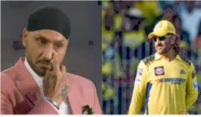
अक्सर खुद को नंबर 7 या 8 पर बैटिंग करने भेजते हैं क्योंकि वे अपनी क्षमता को अच्छी तरह समझते हैं। हरभजन सिंह ने बताया कि धोनी की फिटनेस देखकर वे हैरान थे। उन्होंने धोनी से पूछा कि इस उम्र में यह सब करना मुश्किल नहीं है? धोनी ने जवाब दिया, हां, यह मुश्किल है, लेकिन यही एक चीज है जो मुझे पसंद है। मुझे इसमें खुशी मिलती है। मैं इसे करना चाहता हूँ, बाहर जाना चाहता हूँ और खेलना चाहता हूँ। जब तक भूख है, तब तक आप इसे कर पाएंगे। बिना

नई दिल्ली, 18 मार्च 2025। आईपीएल दुनिया का इकलौता ऐसा टूर्नामेंट है जहां क्रिकेट फैंस को अभी भी एमएस धोनी को खेलते देखने का मौका मिलता है। चेन्नई सुपर किंग्स (सीएसके) के दिग्गज खिलाड़ी एमएस धोनी 2025 सीजन में एक कड़ी ट्रेनिंग के बाद वापसी कर रहे हैं। धोनी अब सिर्फ आईपीएल में ही खेलते हैं, इसलिए 43 साल की उम्र में अपनी फिटनेस बनाए रखना एक मुश्किल काम है।