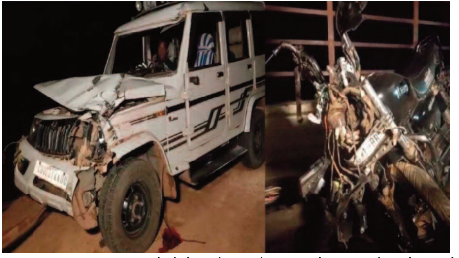
अंतागढ़ जा रहे थे, तभी अंतागढ़ थाना क्षेत्र के पोंडगांव के पास कांकर सांसद भोजराज नाग के फॉलो वाहन ने

भानुप्रतापपुर, 25 फरवरी 2025 (ए)। कांकर के भाजपा सांसद भोजराज नाग के कार्रफिले के वाहन की टक्कर से घायल एक और युवक की जिला अस्पताल में इलाज के दौरान मौत हो गई। अब तक इस हदसे में तीन लोगों की मौत हो गई। तीनों एक ही गांव पोंडगांव के रहने वाले हैं। इस घटना के बाद गांव में आक्रोश देखा जा रहा है। यह हदसा सोमवार रात हुआ। भाजपा सांसद भोजराज नाग भानुप्रतापपुर से