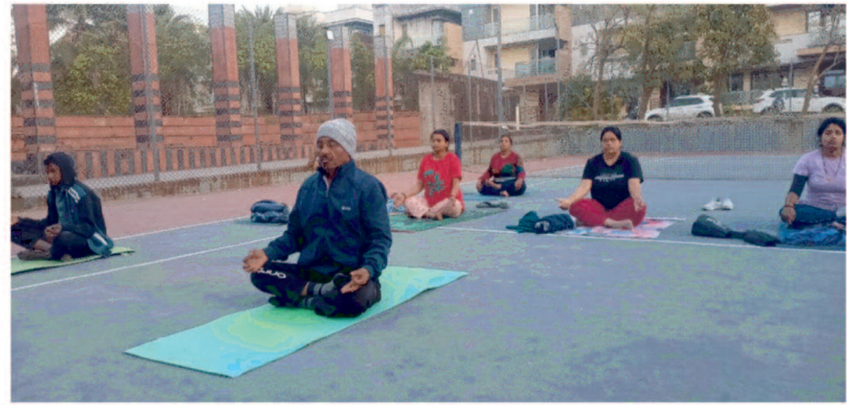
अम्बिकापुर, 25 फरवरी 2025 (घटती-घटना)। पंतजलि परिवार के द्वारा लगभग एक महीने से रायल पार्क कालोनी अम्बिकापुर जिला सरगुजा में प्रातः 5:30 बजे 7:00 बजे तक नियमित रूप से योग विज्ञान सत्र का संचालन किया जा रहा है।