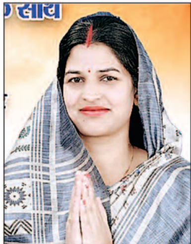
का चुनाव काफी रोमांचक था, कोरिया जिले के जिला पंचायत के 10 सीटों पर जहां प्रत्याशियों का आमना सामना रोमांच से भरा रहा तो वहीं जनपद पंचायत के भी 25 सीटों पर चुनाव काफी