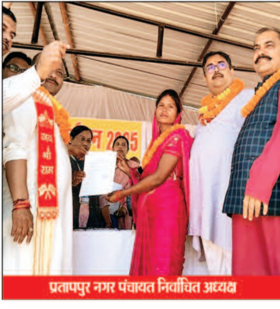
प्रतापपुर नगर पंचायत निर्वाचित अध्यक्ष

सूरजपुर जिले में पांच नगरीय निकाय चुनाव हुए जिसमें एक नगर पालिका व चार नगर पंचायत थे, जिले के इकलौता नगर पालिका सूरजपुर में जिले में दो विधायक एक मंत्री होने के बावजूद टिकट वितरण में पुराने चेहरे पर दावा लगाया भाजपा को बड़ा भारी, 24 मतों से मिली हार भाजपा से घास का जीत काँग्रेस के झोली में आ गया। काँग्रेस के लिए भी यह चुनाव काफी आसान नहीं था काफी कड़े मुकामले में काँग्रेस ने भाजपा प्रत्याशी को हराकर नगर पालिका सूरजपुर चुनाव जीता है, वहीं काँग्रेस में दिग्गज पार्षद भी हारे हैं जो कभी न हारने वाली बाजी खेला करते थे आज उन्हें हार का सामना करना पड़ा, वहीं इकलौता नगर पालिका चुनाव बीजेपी हार गई पर चार नगर पंचायत चुनाव में अध्यक्ष बनने में सफल रही।