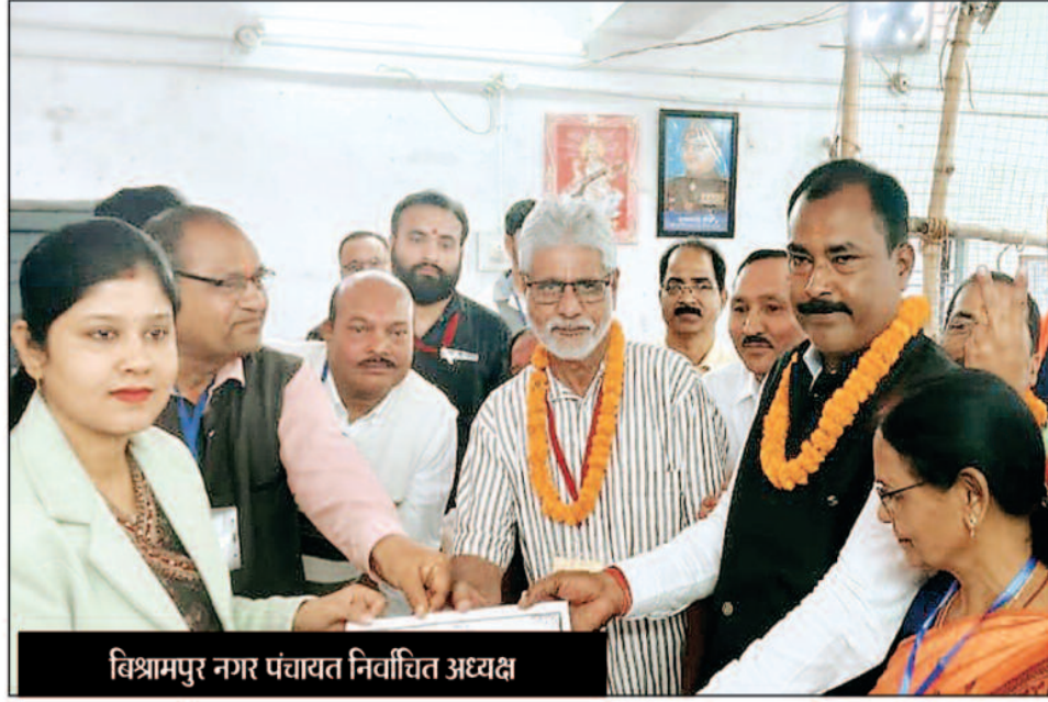
विश्रामपुर नगर पंचायत निर्वाचित अध्यक्ष