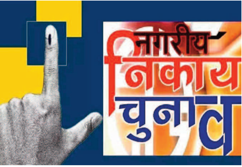
का गठन कर सकेंगे। इससे पहले राज्य निर्वाचन आयोग ने मतगणना होने के

रायपुर, 16 फरवरी 2025 (ए।)। प्रदेश के सभी नगरीय निकायों के चुनाव परिणाम और गठन की अधिसूचना रविवार को ही राज्य निर्वाचन आयोग ने प्रकाशित कर दी। नगरीय प्रशासन विभाग के सूर्यों के मुताबिक इसके बाद अगले 15 दिनों के भीतर सभी निकायों के पहले सम्मेलन और सभी निर्वाचितों को सदस्यता की शपथ करानी होगी। यह कार्यवाही संबंधित कलेक्टर और उनके सक्षम प्राधिकार करारें। इसके उपरांत ही सभी निकायों से प्रशासक वापस लिए जाएंगे। और उसके बाद महापौर-अध्यक्ष, एमआईसी/पीआईसी