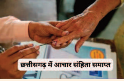
छत्तीसगढ़ में आचार संहिता समाप्त

जहां चुनाव बाकी है उन जगहों पर रहेगी अभी जारी रहेगी