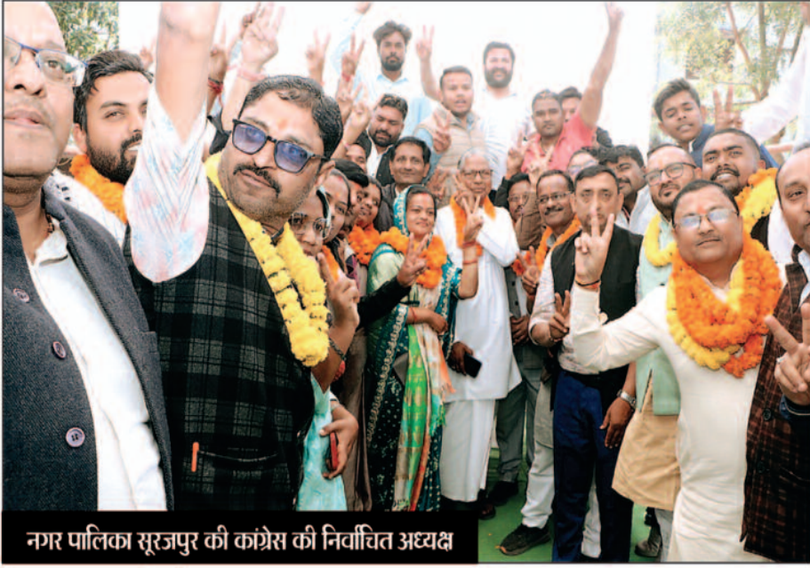
नगर पालिका सूरजपुर की काँग्रेस की निर्वाचित अध्यक्ष

सूरजपुर नगर पालिका चुनाव में पुराने चेहरे पर दावा खेलना भाजपा को पड़ा भारी... 24 मतों से मिली हार... जीता हुआ सूरजपुर हुआ चुनाव हारी भाजपा... विधायक मंत्री भी नहीं जीत पाए... इकलौता नगर पालिका चुनाव... कांग्रेस के दिग्गज पूर्व पार्षद भी हारे चुनाव... मुस्लिम मतदाता ने कांग्रेस पर जताया भरोसा जिसकी बदौलत कांग्रेस को मिली जीत