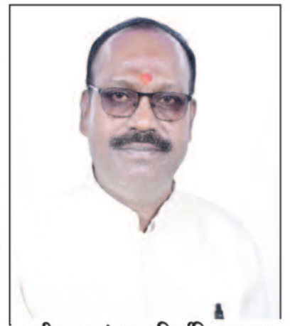
जरही नगर पंचायत निर्वाचित अध्यक्ष

माहिल है। कार्यकर्ताओं ने खेल-नगाड़ों की गूंज के बीच जमकर नारेबाजी और आतिशबाजी की। समर्थकों ने मिठाइयां बांटी और सड़कों पर जुलूस निकालने की तैयारी की जा रही है। भाजपा समर्थकों को उम्मीद थी कि पुनर्गणना से परिणाम बदल सकता है, लेकिन जब नतीजे वही रहे, तो काँग्रेस कार्यकर्ताओं का जोश