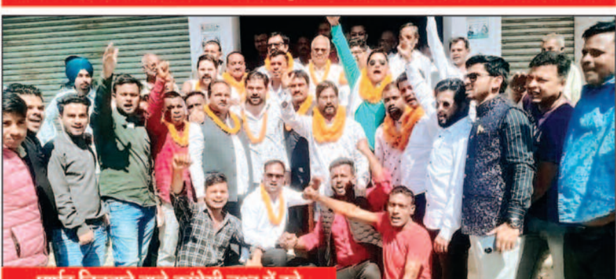
पार्षद जितवाने वाले कांग्रेसी जर्नल में झूरे