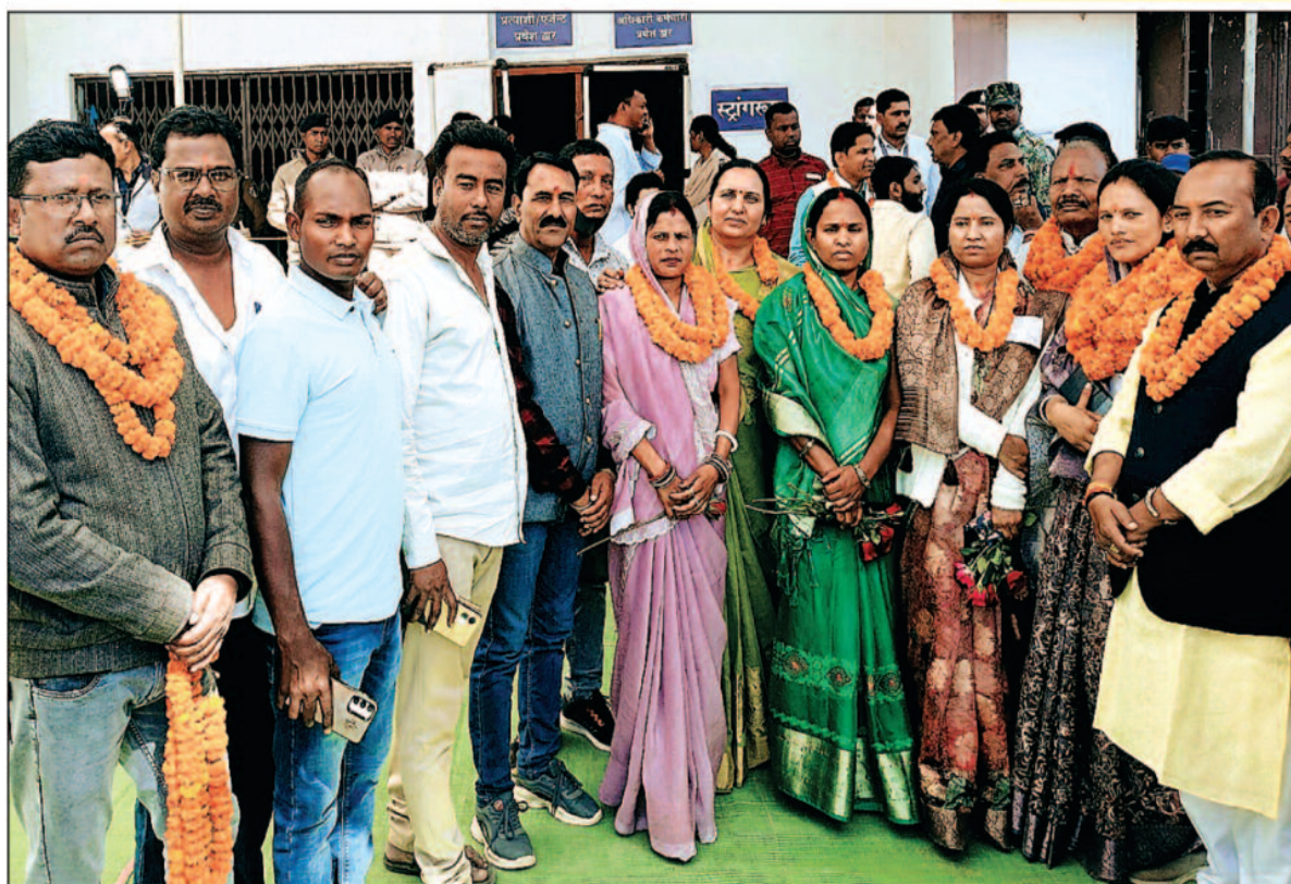
जीत के बाद भाजपाई अपने पार्षद व अध्यक्ष के साथ