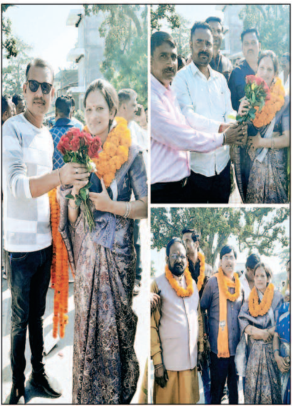
जीतने के बाद अध्यक्ष प्रत्याशी को सदाई देते हुए उनके समर्थक