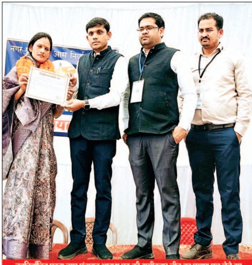
नवनिर्वाचित पटना नगर पंचायत अध्यक्ष पद की उम्मीदवार जीत का प्रमाण पत्र लेते हुए