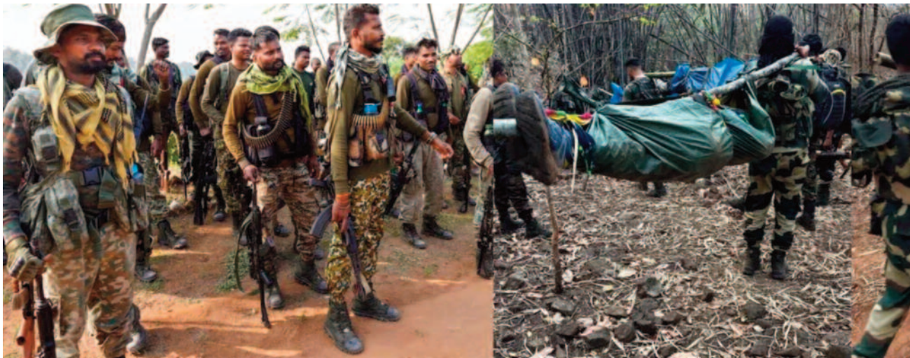
जवानों का कैप खुला और आईईडी लगाने पहुंच गया नक्सली,मौके से किया गया गिरफ्तार

मिशन कगार- 2026 के तहत बस्तर को पूर्ण रूप से नक्सलियों से निजात दिलाने के लिए जगह-जगह कैप स्थापित किये जा रहे हैं। इसी कड़ी में आईटीबीपी जवानों के द्वारा नारायणपुर के अति संवेदनशील क्षेत्र कुतुल में एक नए कैप का उद्घाटन किया गया, कैम्प को खुले 24 घंटे भी नहीं हुए थे कि कैम्प के पास से एक सैदी को गिरफ्तार किया गया, जिसके पास से बिजली तार के साथ ही आईईडी कुकर बरामद किया गया है।