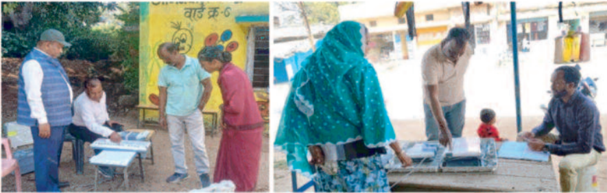
» वार्डों में मतदाताओं को कराया जा रहा है ईएस-ऑन

- संवाददाता - बलरामपुर, 06 फरवरी 2025 (घटती-घटना)। नगरीय निकाय निर्वाचन 2025 के लिए जिले में मतदाताओं को ईवीएम (इलेक्ट्रॉनिक वोटिंग मशीन) की प्रक्रिया से अवगत कराने के लिए वार्डों में व्यापक स्तर पर जागरूकता अभियान चलाया जा रहा है। प्रदर्शनों के माध्यम से