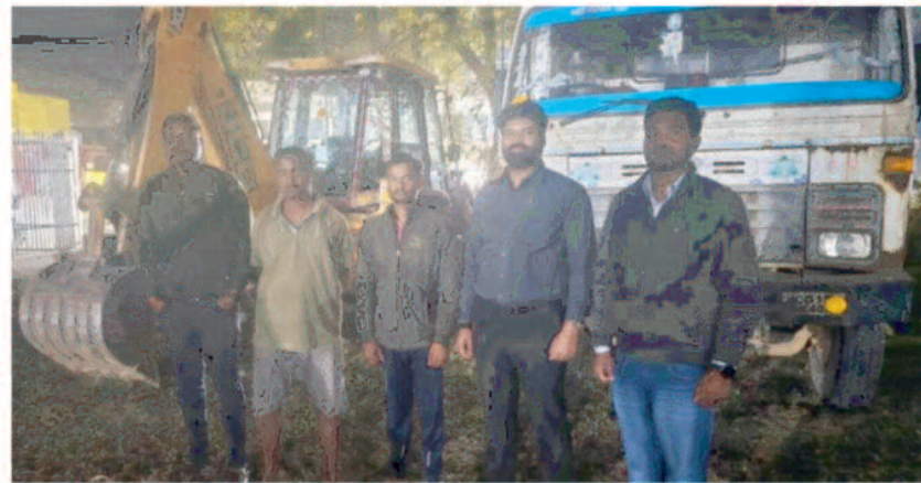
- संवाददाता - बलरामपुर, 06 फरवरी 2025 (घटती-घटना)।

बताया जा रहा है कि नगरीय निकाय चुनावों में मतदाता को दो पदों अध्यक्ष एवं पार्षद के लिए मतदान करना होगा। इस प्रक्रिया के तहत नगर पालिका अध्यक्ष पद के लिए मतदाता को सफेद लेबल वाले उम्मीदवार के सामने स्थित बटन दबाना होगा। मतदान की पुष्टि के लिए बीप की छोटी आवाज सुनाई देगी। पार्षद पद के लिए मतदाता को गुलाबी लेबल वाले उम्मीदवार के सामने बटन दबाना होगा। इस बार बीप की लंबी आवाज सुनाई