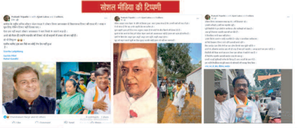
सोशल मीडिया की टिप्पणी