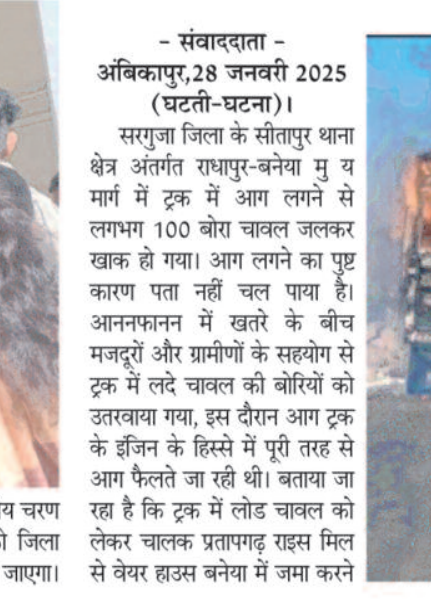
संवाददाता - अंबिकापुर, 28 जनवरी 2025 (घटती-घटना)। सरगुजा जिला के सीतापुर थाना क्षेत्र अंतर्गत राधापुर-बनेया मु य मार्ग में आग लगने से लगभग 100 बोत चावल जलकर खाक हो गया।

आग लगने का पुष्ट कारण पता नहीं चल पाया है। आननफानन में खारे के बीच मजदूरों और ग्रामीणों के सहयोग से ट्रक में लदे चावल की बोरियों को उतखाया गया, इस दौरान आग ट्रक के इंजन के हिस्से में पूरी तरह से आग फैलते जा रही थी। बताया जा रहा है कि ट्रक में लोड चावल को लेकर चालक प्रतापगढ़ रहस्य मिल से वेयर हाउस बनेया में जमा करने जा रहा था।