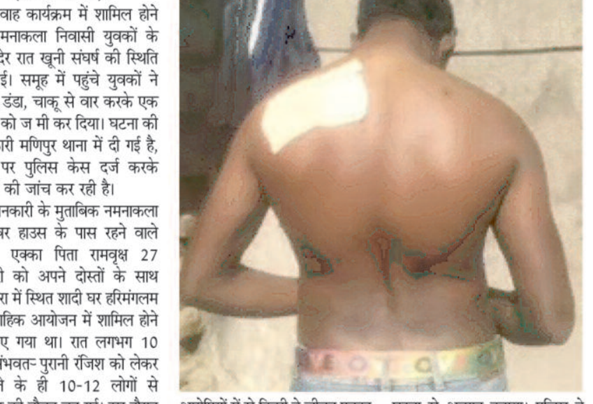
अंबिकापुर, 28 जनवरी 2025 (घटती-घटना)। विवाह कार्यक्रम में शामिल होने गए नमनाकला निवासी युवकों के बीच देर रात खूनी संघर्ष की स्थिति बन गई।