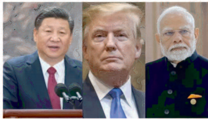
पीएम मोदी से बीती रात हुई बातचीत

संस्थापक सदस्य हैं और केवल अपने हित देख रहे हैं। ट्रंप ने यह भी कहा कि अपने सर्वोत्तम हितों के लिए तीनों देश हमें नुकसान पहुंचाना चाह रहे हैं।