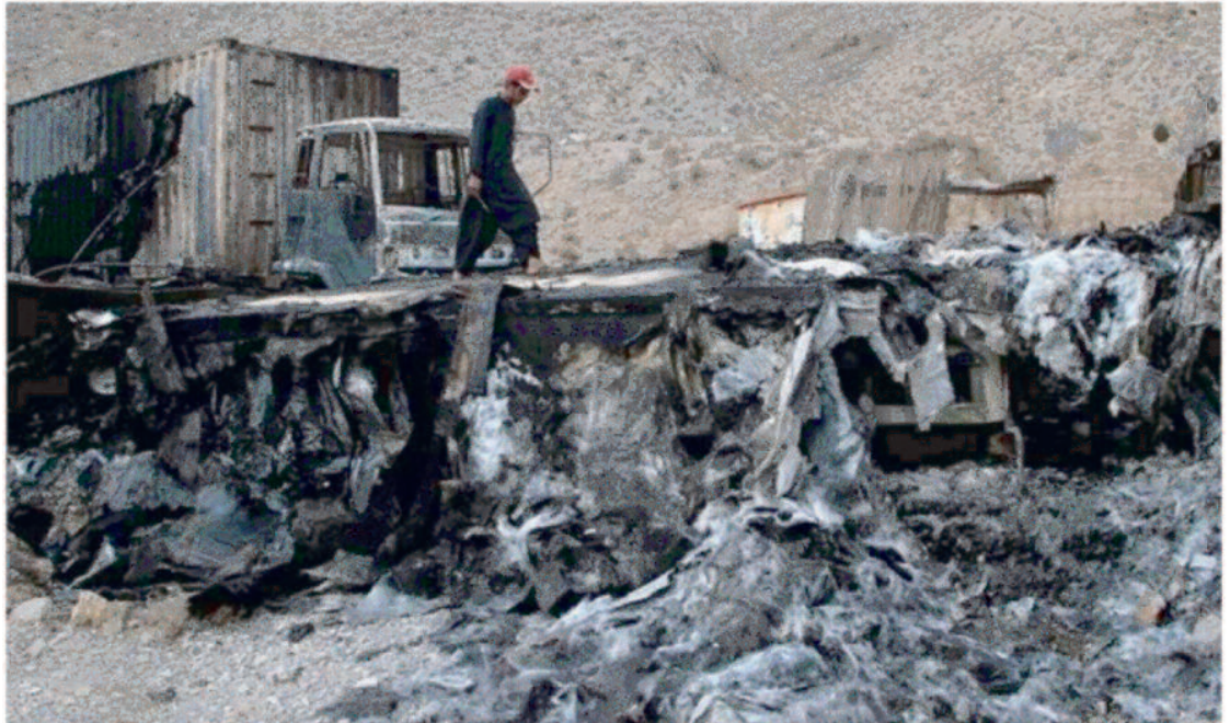
पेशावर, 28 जनवरी 2025। उत्तर-पश्चिमी पाकिस्तान में अज्ञात हथियारबंद लोगों ने कुर्म जिले में डीजल और पेट्रोल की आपूर्ति बाधित करने के लिए तेल टैंकरों के काफिले पर हमला कर दिया।

पुलिस और सुरक्षा बलों की निगरानी में बागान बाजार पहुंचा, तो बदमाशों ने पास के तालु कुंज इलाके से गोलीबारी शुरू कर दी। अधिकारियों ने बताया कि तीन काफिलों ने हांगू जिले के थाल क्षेत्र से कुर्म तक खाद्य और अन्य आवश्यक वस्तुएं पहुंचाईं। उन्होंने बताया कि पहले काफिले में 62 वाहन थे जबकि दूसरे में 58 बड़े मालवाहक ट्रक थे। अधिकारियों ने बताया कि पांच टैंकरों सहित तीसरे काफिले ने मार्गों के बंद होने के बाद पहली बार सोमवार को सफलतापूर्वक पेट्रोलियम उत्पादों को कुर्म पहुंचाया।