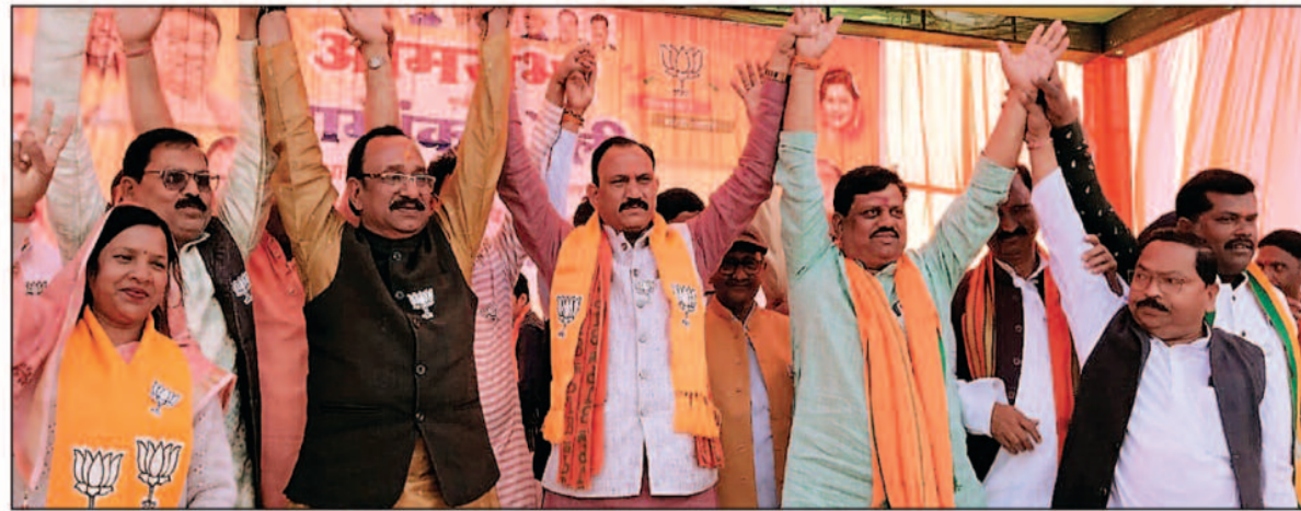
-संवाददाता- चिरमिरी/एमसीबी 28 जनवरी 2025 (घटती-घटना)।