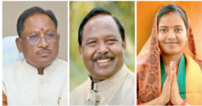
अम्बिकापुर/सूरजपुर/बलरामपुर, 25 जनवरी 2025 (घटती-घटना)।