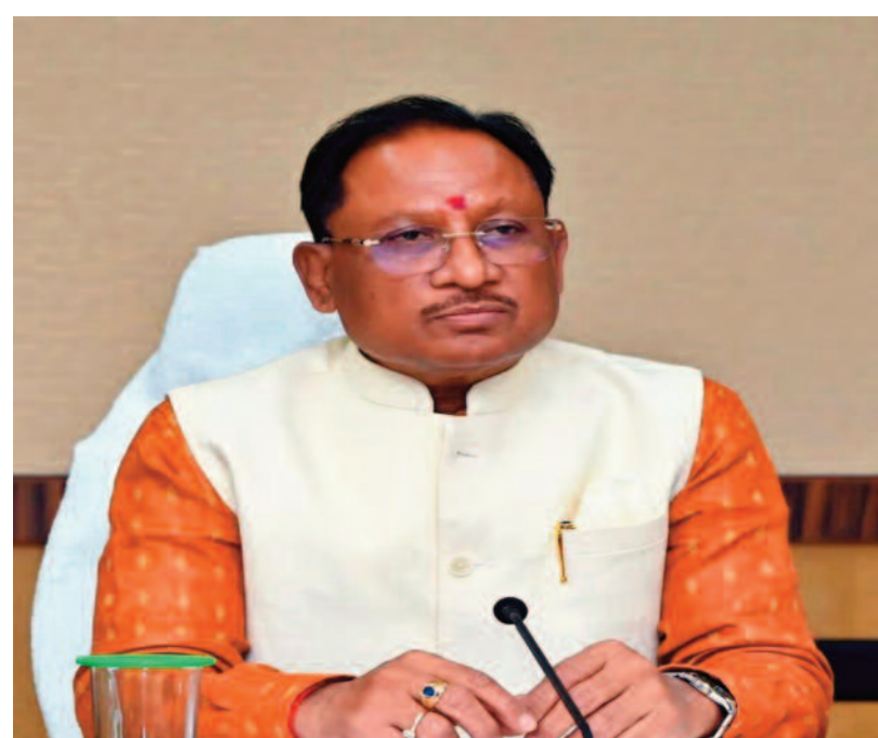
दूसरी तरफ बीजेपी संगठन के चुनाव भी हो रहे हैं। संगठन चुनाव के शेड्यूल के अनुसार, 30 दिसंबर तक जिला अध्यक्षों की नियुक्ति करना है।

रायपुर, 25 दिसम्बर 2024 (ए)। छत्तीसगढ़ में संभावित कैबिनेट विस्तार पर अटकलों के दौर को सीएम विष्णुदेव साय ने खत्म कर दिया है। दिल्ली में छत्तीसगढ़ बीजेपी को लेकर हुई अहम बैठक के बाद माना जा रहा था कि नगरीय निकाय चुनाव से पहले राज्य में कैबिनेट का विस्तार हो सकता है। कैबिनेट विस्तार की अटकलों पर