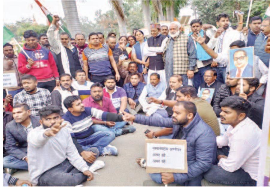
- संवाददाता - अम्बिकापुर, 24 दिसम्बर 2024 (घटती-घटना)। जिला कांग्रेस कमेटी सरगुजा द्वारा शहर में बाबा साहेब सम्मान मार्च निकाला गया। सविधान पर वचों के दौरान राज्यसभा में देश के

गृहमंत्री अमित शाह के द्वारा सविधान निर्माता बाबा साहेब भीमराव अंबेडकर पर की गई अमर्यादित टिप्पणी के विरोध में कांग्रेस ने राष्ट्रीय स्तर पर सभी जिला मुख्यालय में इसका आयोजन किया था। इसका उद्देश्य मंत्रिमंडल से अमित शाह की