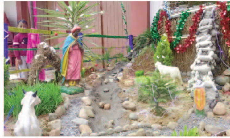
- संवाददाता - अम्बिकापुर, 24 दिसम्बर 2024 (घटती-घटना)।

प्रभु यीशु के जन्मदिन पर गिरिजाघरों को आकर्षक ढंग से सजाया गया था। वहीं मसीही समाज के लोग अपने-अपने घरों को भी रंग-बिरंगी रोशनी से सजाए थे। 24 दिसंबर को शाम होते ही काफी संख्या में समाज के महिला-पुरुष व बच्चे गिरजाघरों में पहुंचना शुरू कर दिए थे। रात 9 बजे से अनुष्ठान शुरू हो गए थे। मुख्य आयोजन नवापारा गिरजाघर में आयोजित किया गया। यहां काफी संख्या में श्रद्धालु पहुंचे थे। रात 12 बजते ही गिरिजाघर का घंटा बजते ही लोग प्रभु यीशु का जन्मोत्सव मनाने में जुट गए।