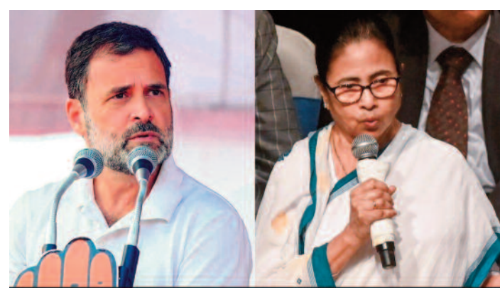
उन्होंने ममता बनर्जी और उद्धव ठाकरे को इंडिया गठबंधन के लिए सबसे अच्छे नेता माना है। मलिक का यह बयान ने ममता बनर्जी को एक मजबूत और प्रभावशाली नेता के तौर पर पहचाना है। उनका यह यह बयान ऐसे समय में के सभी दल ममता बनर्जी को अपने नेता के रूप में आगे आने दें तो यकीन

नई दिल्ली, 08 दिसम्बर 2024(ए)। बंगाल की मुख्यमंत्री ममता बनर्जी ने इंडिया गठबंधन के नेतृत्व पर अपना दावा ठेका है। कांग्रेस इस दावे से असहज हो गई है लेकिन समाजवादी पार्टी और शरद पवार की एनसीपी ने ममता के नाम का समर्थन किया है। इस बीच पूर्व गवर्नर सत्यपाल मलिक ने भी अपनी राय व्यक्त की है। उनका कहना है कि अगर इंडिया गठबंधन के सभी दल ममता बनर्जी को अपने नेता के रूप में आगे लाते हैं, तो यह गठबंधन निश्चित रूप से सफल होगा।