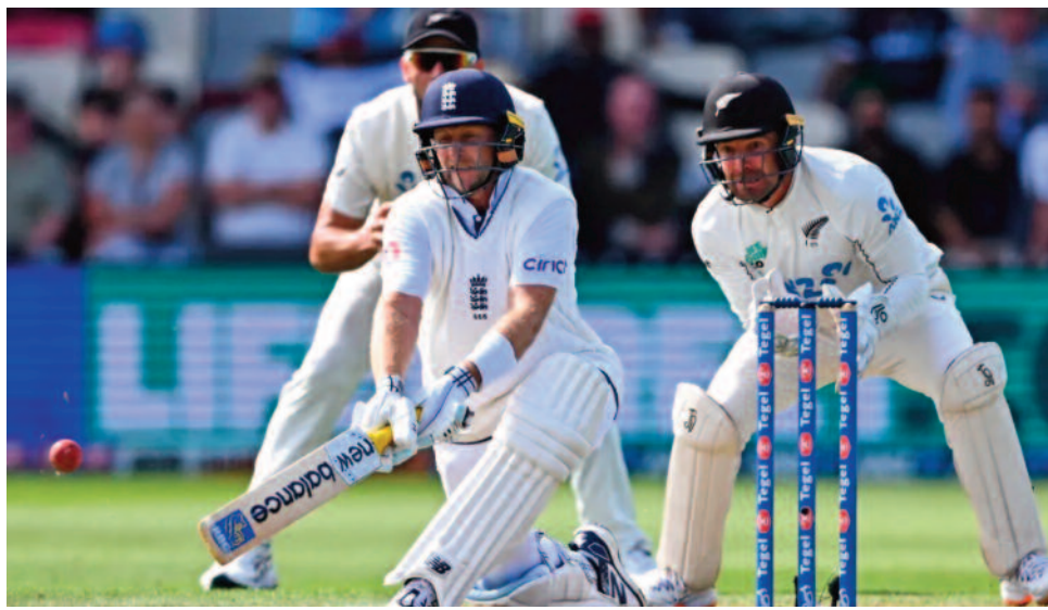
इंग्लैंड ने अपनी स्थिति मजबूत कर ली है और वह इस समय ड्राइविंग सीट पर मौजूद है। इंग्लैंड और न्यूजीलैंड के

बर्मिंघम, 07 दिसम्बर 2024। टेस्ट फॉर्मेट क्रिकेट का सबसे पुराना फॉर्मेट है। यहां प्लेयर्स के धैर्य की असली परीक्षा होती है। टेस्ट फॉर्मेट में प्लेयर्स को पांच दिन तक खुद को ऊर्जा से भरपूर और मानसिक रूप से मजबूत रखना होता है। बल्लेबाज यहां त्रिज पर टिककर पारी को आगे बढ़ाते हैं। जब से टी20 क्रिकेट का चलन बढ़ा है, बल्लेबाज टेस्ट में भी तेजी के साथ रन बनाने लगे हैं। इसी वजह से यहां भी रोज नए रिकॉर्ड बन और टूट रहे हैं। इस समय एक तरफ भारत बनाम ऑस्ट्रेलिया के बीच मैच हो रहा है। वहीं इंग्लैंड और न्यूजीलैंड के बीच भी टेस्ट मुकाबला खेला जा रहा है। इस मैच में