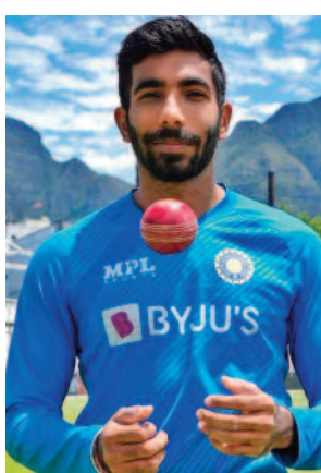
बुमराह एशियाई गेंदबाजों की लिस्ट में चौथे स्थान पर पहुंच गए हैं। वह सेना यानी साउथ अफ्रीका, इंग्लैंड, न्यूजीलैंड, ऑस्ट्रेलिया में 53 पारियों में

एडिलेड, 07 दिसम्बर 2024। भारत के स्टार तेज गेंदबाज जसप्रीत बुमराह ने पर्थ के बाद ऑस्ट्रेलिया के खिलाफ एडिलेड में भी गर्दा उड़ाया है। पर्थ टेस्ट में 8 विकेट झटकने के बाद बुमराह ने एडिलेड में खेले जा रहे दूसरे मैच की पहली पारी में चार विकेट चटकाए। उन्होंने डे-नाइट टेस्ट में ओपनर उस्मान ख्वाजा (13), मैकस्वीनी (39), स्टीव स्मिथ (2) और पैट कर्मिस को अपना शिकार बनाया। इस दौरान उन्होंने शमी और जहीर खान का खास रिकॉर्ड भी तोड़ा है। एएसईएन देशों में सबसे ज्यादा विकेट लेने के मामले में जसप्रीत