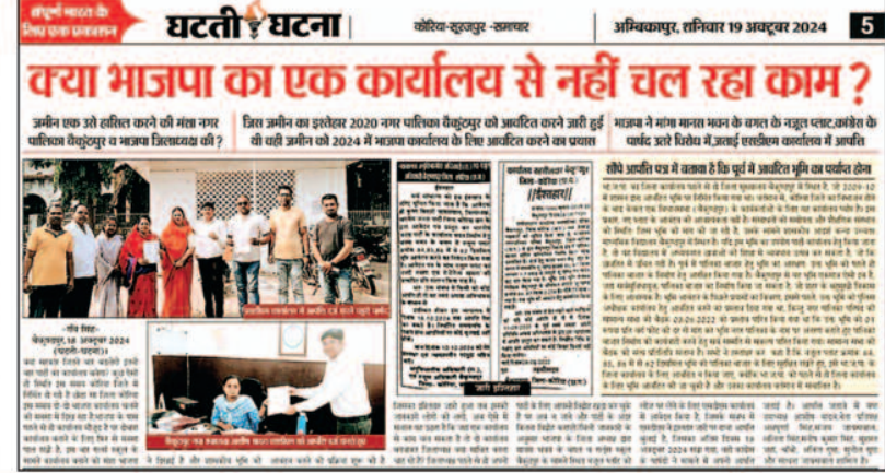
एक जिले में और खासकर जिला मुख्यालय में एक ही जिला कार्यालय बना सकती हैं कोई भी पार्टी.नियम

बताया जा रहा है की राजनीतिक दलों को जिले में खासकर जिला मुख्यालय में एक ही जिला कार्यालय बनाने के लिए भूमि आवंटित किया जायेगा ऐसा नियम है। भाजपा सहित कांग्रेस के पास पहले से कार्यालय हैं और अब पुनः जिलाध्यक्ष भाजपा नया कार्यालय बनाने के लिए भूमि आवंटन की मांग कर रहे थे जिसे नियम विरुद्ध पाए जाने पर अस्वीकार किया गया प्रशासन द्वारा। इशतहार जारी होने उपरांत कार्यवाही पर रोक लगना सत्ताधारी दल के लिए एक बड़ी असफलता भाजपा जिला कार्यालय के लिए दूसरी बार जमीन आवंटन के लिए जिलाध्यक्ष भाजपा कोरिया प्रयासरत थे और उन्होंने अपने पदीय महत्व का फायदा उठाकर भूमि आवंटन के लिए इशतहार भी प्रकाशित करवा लिया था लेकिन जब बात फैली और विरोध हुआ मामला ठंडे बस्ते में चला गया। वैसे पूरे मामले में जिलाध्यक्ष भाजपा सहित सत्ताधारी दल को भी काफी झटका लगा है क्योंकि सत्ता में रहते हुए उन्हें बैकफुट पर आना पड़ा है।