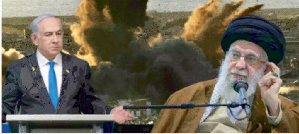
ने भी उनके सुर से सुर मिली। उनमें से कई ने चेतावनी दी कि ईरान को अपने प्राक्सि हिजबुल्लाह की हरकतों पर

नेतन्याहू के बयान के बाद उनकी सरकार में शामिल नेताओं और विपक्षियों