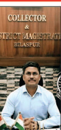
विशेष संवाददाता- बिलासपुर, 18 अक्टूबर 2024 (घटती-घटना)।

लिंगियाडीह खसरा नंबर 54/1 करोड़ों की शासकीय भूमि में भू माफियाओं का कब्जा-