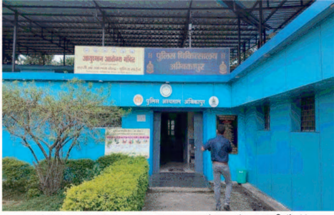
क्लीनिक में डॉक्टर व स्टाफ की कमी का मुद्दा उठा था। मामले पर पक्ष व विपक्ष के पार्षद एक राय होकर स्वास्थ्य विभाग से जल्द से जल्द डॉक्टर व स्टाफ की कमी को दूर करने की बात कही गई थी।

क्लीनिक में इलाज नहीं मिल पा रहा है। निजी अस्पतालों से छुटकारा व जिला अस्पताल का चक्कर न लगाने पड़े इसके लिए कांग्रेस शासन काल में हमर क्लीनिक की शुरुआत की गई है। लेकिन अम्बिकापुर में यह सुविधा अब धीरे-धीरे खत्म होती नजर आ रही है। अम्बिकापुर नगर निगम के 48 वार्ड अंतर्गत 8 हमर क्लीनिक संचालित है। लेकिन सभी में स्टाफ की कमी बनी हुई है। कुछ जगहों पर डॉक्टर भी नहीं हैं। जबकि हर हमर क्लीनिक में 1 डॉक्टर के साथ 5 स्टाफ का सेंटअप दिया गया था। लेकिन किसी भी हमर क्लीनिक में स्टाफ नहीं है। इससे मरीजों को समुचित स्वास्थ्य सुविधा नहीं मिल पा रही है। आज भी लोग निजी अस्पताल व जिला अस्पताल का चक्कर लगाने को मजबूर हैं। कुछ दिन पूर्व नगर निगम के सामान्य सभा में भी हमर