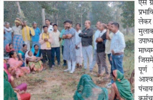
टियर गैस फेंका गया। महिलाओं की पुरुष पुलिसकर्मियों ने पिटाई की। जिला पंचायत उपाध्यक्ष जिस जगह पर ग्रामीणों के दल से मिले वहीं मौजूद कई ग्रामीण जिनमें महिलाएं भी थी वो घायल अवस्था में मिली। उन्हें इलाज उपलब्ध नहीं था। इसपर जिला पंचायत उपाध्यक्ष ने कलेक्टर से चर्चा की। बजे से गांव में कैम्प लगाने का आश्वासन दिया है। जिला पंचायत उपाध्यक्ष ने बिना

ग्रामीणों का कहना था कि जब वे शान्ति पूर्वक इसका प्रतिवाद कर रहे थे तब पुलिस ने उन्हें बलपूर्वक खदेड़ना प्रारंभ किया। इस दौरान ग्रामीणों पर लाठीचार्ज किया गया और