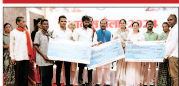
संवाददाता- कोरिया, 18 अक्टूबर 2024 (घटती-घटना)।