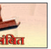
एवं सरपंच के विरुद्ध धारा 40 के तहत कार्रवाई की जा रही है। गौरतलब है कि ग्राम पंचायत घुमाड़ंड में प्रधानमंत्री

आवास योजना ग्रामीण अंतर्गत कराया जा रहा आवास की समीक्षा पर पाया गया कि योजना अंतर्गत आवास स्वीकृति के लिए नियमित शिक्षिका के पति के नाम पर ग्रामसभा से अनुमोदन करते हुए आवास की पात्रता सूची में एक शिक्षिका के पति है उनको पात्रता की सूची में रखा गया