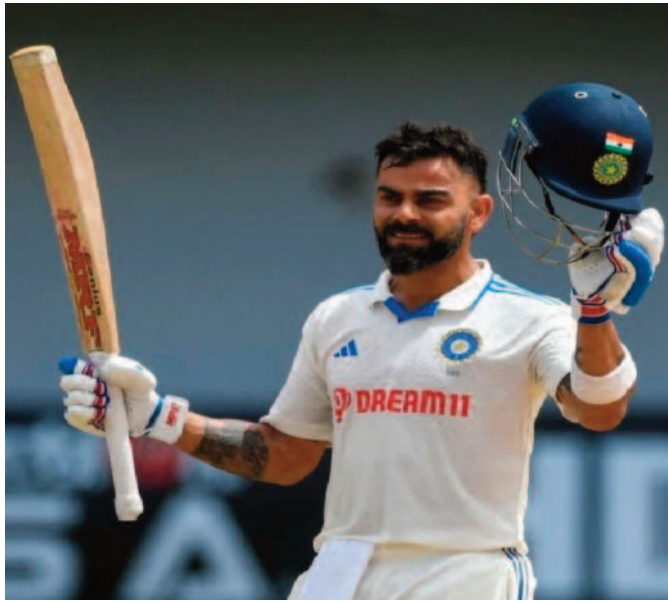
विराट से पहले ये कारनामा सचिन तेंदुलकर, राहुल द्रविड़ और सुनील गावस्कर कर चुके हैं। वह टेस्ट में नौ हजार रन या उससे ज्यादा रन बनाने वाले 18वें बल्लेबाज भी बन जाएंगे। भारत के पूर्व कप्तान विराट कोहली ने अब तक अपने टेस्ट करियर में 115 मैच खेले हैं और 8947 रन बनाए हैं। इसमें 29 शतक और सात दोहरा शतक शामिल हैं। उन्हें नौ हजार रन का बैरियर पार करने के लिए महज 53 रन की जरूरत है। कोहली ने 30 अर्धशतक भी लगाए हैं, उनका बेस्ट स्कोर 254 है। भारत तीन मैचों की घरेलू टेस्ट सीरीज के लिए तैयार है उसके बाद ऑस्ट्रेलिया का चुनौतीपूर्ण दौर होगा। ऐसे में विराट का अनुभव और टीम के लिए उनका सम्पूर्ण अहम साबित होगा। न्यूजीलैंड के खिलाफ सीरीज शुरू होने से पहले भारतीय क्रिकेट टीम के कोच गौतम गंभीर ने विराट कोहली की तारीफ करते हुए कहा कि उनमें रनों की भूख पहले की तरह ही बरकरार है।

नई दिल्ली, 15 अक्टूबर 2024। भारतीय टीम के स्टार बल्लेबाज विराट कोहली का बल्ले पिछले कुछ मैचों से शांत रहा है। न्यूजीलैंड के खिलाफ तीन मैचों की टेस्ट सीरीज में फैंस को कोहली से कई उम्मीदें हैं। विराट द्वारा खेली गई पिछली आठ पारियों में महज एक अर्धशतक निकला है। वो भी उन्होंने 2023 में साउथ अफ्रीका के खिलाफ लगाया था। 16 अक्टूबर से भारत और न्यूजीलैंड के बीच पहला टेस्ट मैच खेला जाएगा। विराट कोहली टेस्ट क्रिकेट में 9000 रन बनाने वाले बल्लेबाज बनने के काफी करीब हैं। 16 अक्टूबर से चिन्नास्वामी स्टेडियम में न्यूजीलैंड के खिलाफ शुरू होने वाले पहले टेस्ट में विराट कोहली को 9 हजार रन पूरे करने के लिए 53 रनों की जरूरत है। अगर वह ऐसा करने में कामयाब होते हैं तो वह टेस्ट में 9000 रन से ज्यादा बनाने वाले चौथे भारतीय बल्लेबाज बन जाएंगे।