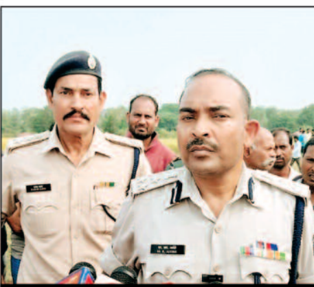
मौके पर पहुंचे एसपी सूरजपुर

आरोपी घटना को अंजाम देने के बाद पुलिस के साथ लुका छुपी खेल रहा था तब तक पुलिस को भी नहीं पता था कि इतनी बड़ी घटना को वारदात आरोपी ने दे दिया है पुलिस पकड़ने का प्रयास कर रही थी पर पुलिस के हथिये नहीं चढ़ पाया कुख्यात आरोपी। ऐसा माना जा रहा है कि पुलिस आरोपी को पकड़ने के लिए पूरी ताकत झोंक देगी पर पुलिस के हथिये कब चढ़ेगा आरोपी इसे लेकर संशय बरकरार है।