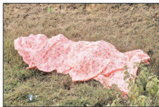
पत्नी मेहू फैज शव