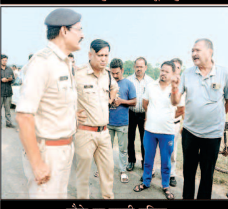
मौके पर पहुंची पुलिस