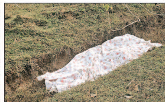
बेटी आलिया शेष