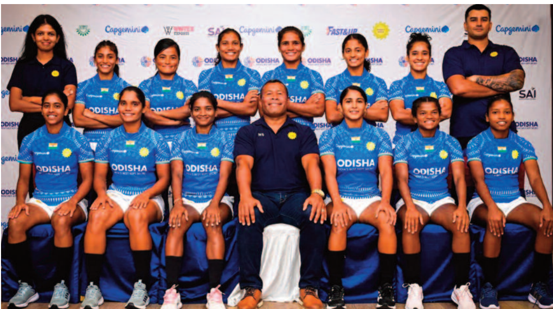
सेरेवी के नेतृत्व में एशिया रग्बी सेवर्स ट्रॉफी की तैयारी के लिए साई, कोलकाता में कठोर प्रशिक्षण शिविर आयोजित किया।

पुरुष और महिला दोनों टीमों 2 अक्टूबर को नेपाल के लिए रवाना हुईं, जहां उन्होंने विशेष रूप से नए भारतीय सेवर्स हेड कोच वैसाले