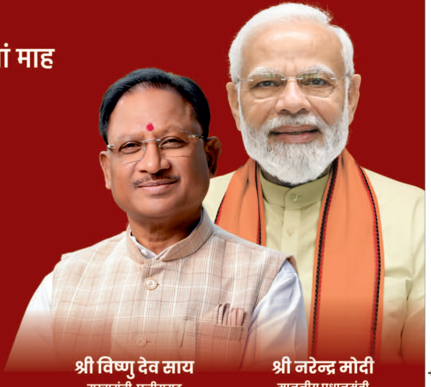
श्री विष्णु देव साय मुख्यमंत्री, छत्तीसगढ़

मुख्यमंत्री विष्णु देव साय से जुड़ने के लिए QR CODE स्कैन करें