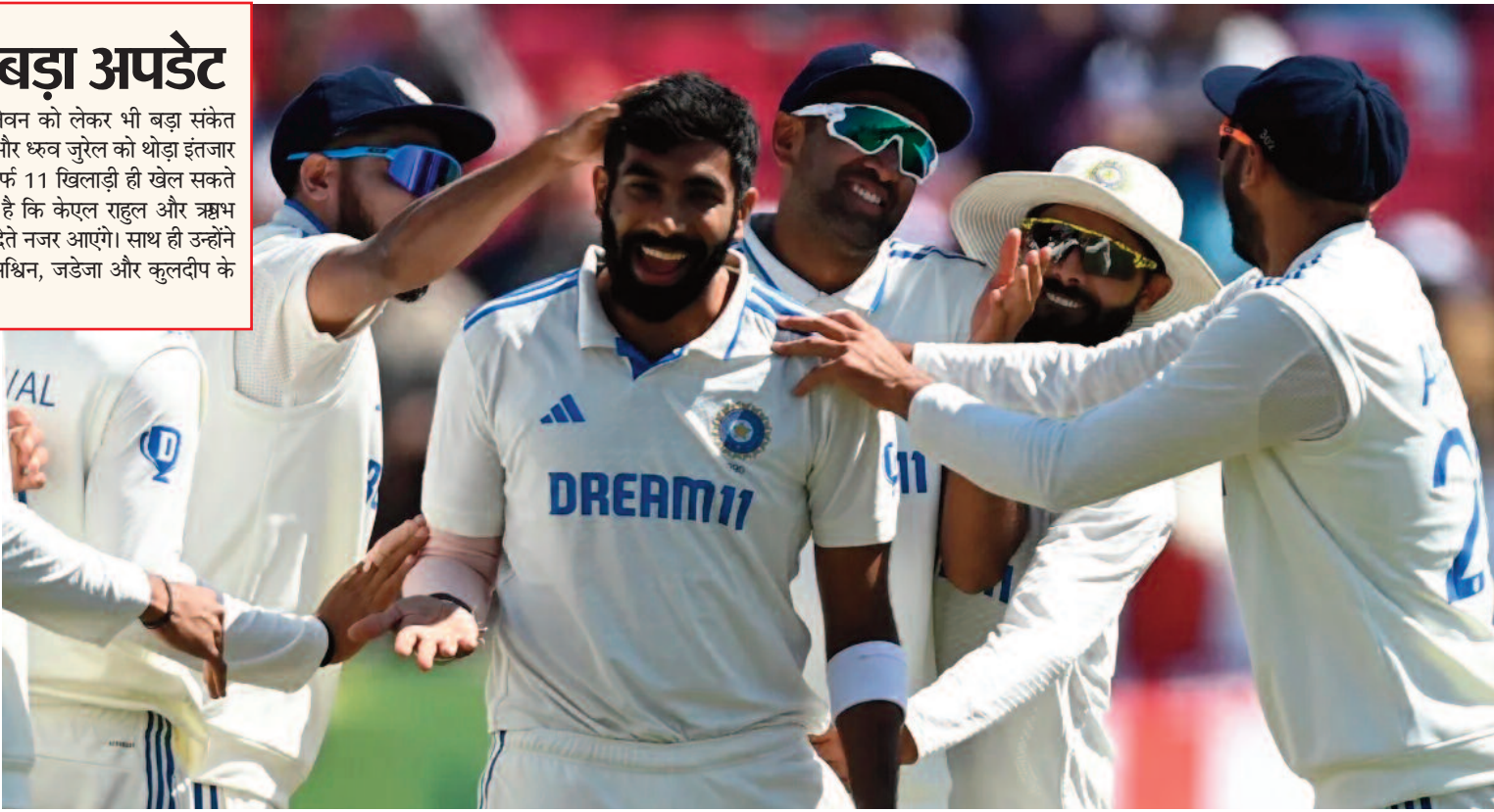
खेल खेलेगी जैसा कि एक चैंपियन टीम खेलती है। हेड कोच ने भारतीय गेंदबाजी की तारीफ करते हुए कहा कि एक समय था जब भारतीय टीम में बल्लेबाजी

चेन्नई, 18 सितम्बर 2024। भारत और बांग्लादेश के बीच चेन्नई में 19 सितम्बर से टेस्ट सीरीज का आगाज होना है। बांग्लादेश की टीम ने हाल ही में पाकिस्तान को उसी के घर में टेस्ट सीरीज में 2-0 से मात दी। ऐसे में टीम इंडिया मेहमान बांग्लादेश को हलके में लेने की गलती नहीं करना चाहेगी। पहले टेस्ट मैच से पहले भारतीय क्रिकेट टीम के हेड कोच गौतम गंभीर ने भी कहा कि वह बांग्लादेश का सम्मान करते हैं लेकिन उनकी वैसे ही