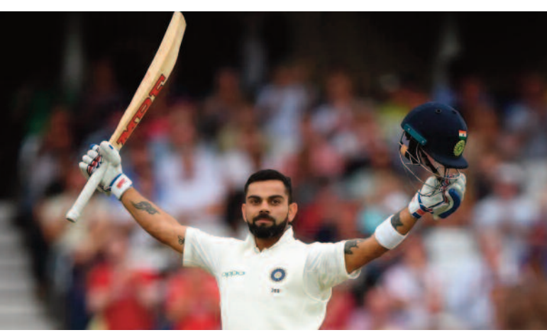
हैं। बांग्लादेश के खिलाफ पहले टेस्ट में विराट कोहली 9 चौके जड़ते ही टेस्ट क्रिकेट में एक हजारी चौके पूरे कर लेंगे। ऐसा करने वाले वह छठे भारतीय बल्लेबाज बन जाएंगे।

नई दिल्ली, 18 सितम्बर 2024। मेजबान टीम इंडिया और बांग्लादेश के बीच 2 मैचों की टेस्ट सीरीज को पहले मैच का आगाज 19 सितम्बर से चेन्नई में होगा। इस मैच के जरिए विराट कोहली लंबे समय बाद टेस्ट फॉर्मेट में खेलते नजर आएंगे। पहले टेस्ट में विराट कोहली के निशाने पर वैसे तो कई बड़े रिकॉर्ड होंगे लेकिन एक मुकाम ऐसा है जिसको वह पहली ही पारी में हासिल कर सकते हैं। ये रिकॉर्ड शतक या अर्धशतक से जुड़ा नहीं है बल्कि वाइंडी से जुड़ा है। विराट कोहली पहले टेस्ट में अगर 9 चौके जड़ देते हैं तो वह एक हजारी क्लब में शामिल हो जाएंगे। इससे पहले ये कारनामा भारत की ओर से सिर्फ 5 बल्लेबाज ही कर पाए थे। इनमें सचिन तेंदुलकर, राहुल द्रविड़, वीरेंद्र सहवाग, वीवीएस लक्ष्मण और सुनील गावस्कर शामिल