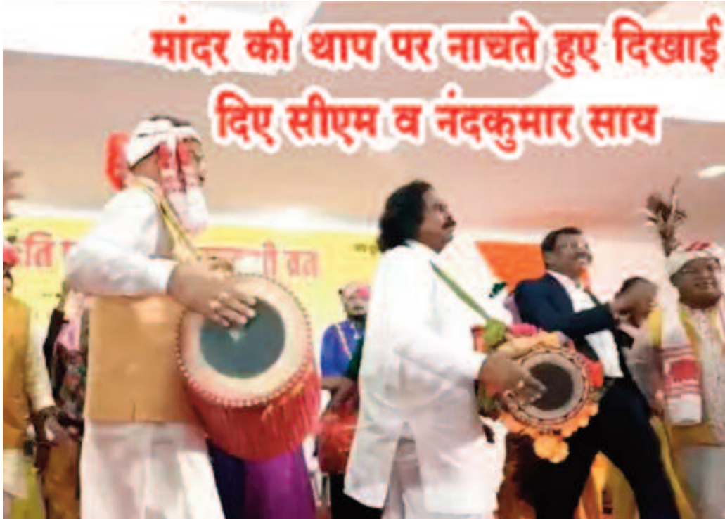
नंद कुमार साय के साथ सीएम ने किया डांस

मुख्यमंत्री विष्णुदेव साय करमा तिहार के उल्लास में शामिल होने से खुद को रोक नहीं पाए और मांदर पर