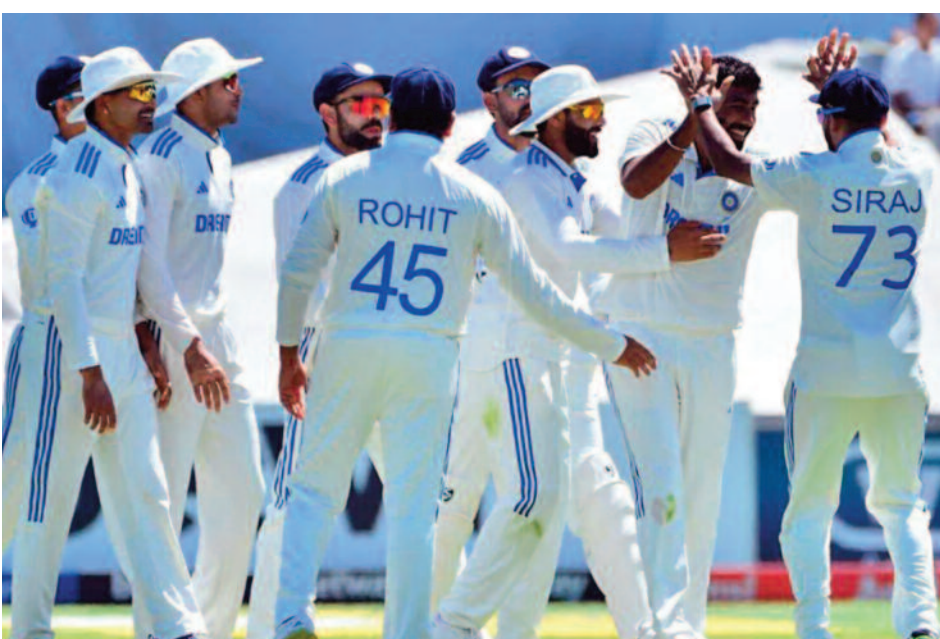
अहम मौके पर 187 गेंदों में 89 रनों की पारी खेलने के साथ टीम का स्कोर 290 रनों तक पहुंचने में मुख्य भूमिका निभाई थी तो वहीं तनुष कोटियन ने इस मुक़ाबले में कुल 5 विकेट अपने नाम किए जिसमें की चार उन्होंने दूसरी पारी में हासिल किए। इसके अलावा शम्स मुलानी भी गेंद से कमाल दिखाने में कामयाब रहे और मैच में कुल 4 विकेट अपने नाम किए। इंडिया के लिए इस मैच में बल्लेबाजी में

नई दिल्ली, 15 सितम्बर 2024। दलीप ट्राफी 2024 में इंडिया ए ने डी के खिलाफ खेले गए मुक़ाबले को चौथे दिन 186 रनों से अपने नाम करने के साथ अपनी पहली जीत भी दर्ज की। मयंक अग्रवाल की कप्तानी में दूसरे राउंड में खेल रही इंडिया ए टीम का इस मुक़ाबले में गेंद और बल्ले दोनों से बेहतरीन प्रदर्शन देखने को मिला। इस मैच में इंडिया डी को चौथी पारी में 488 रनों का टारगेट मिला था लेकिन पूरी टीम 301 के स्कोर पर सिमट गई, जिसमें उनके कप्तान श्रेयस अय्यर 41 और इसके अलावा संजु सैमसन 40 रन की ही पारी खेलने में कामयाब हो सके। हालांकि रिकी भुई ने जरूर 113 रनों की शतकीय पारी खेली लेकिन वह अपनी टीम को जीत दिलाने में कामयाब नहीं हो सके।