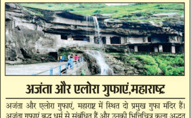
अजंता और एलोरा गुफाएं, महाराष्ट्र

गोलकुंडा किला, हैदराबाद में स्थित एक विशाल किला है और यह कुतुब शाही वंश का निवास स्थान था। इस किले की दीवारें बहुत मजबूत हैं। गोलकुंडा किला का भ्रमण हैदराबाद के इतिहास और संस्कृति के बारे में जानने का एक शानदार अवसर हो सकता है। इसलिए आपको यहां जरूर जाना चाहिए।