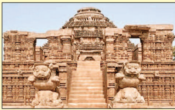
कोणार्क सूर्य मंदिर, ओडिशा

विक्रमशिला विश्वविद्यालय, बिहार में स्थित एक प्राचीन विश्वविद्यालय था और यह भारत के सबसे मशहूर शिक्षण संस्थानों में से एक था। इस विश्वविद्यालय के खंडहर आज भी मौजूद हैं और वे भारत के प्राचीन शिक्षा प्रणाली की झलक पेश करते हैं। भारत के इतिहास और शिक्षा के बारे में जानने के लिए आपको एक बार यहां जरूर जाना चाहिए।