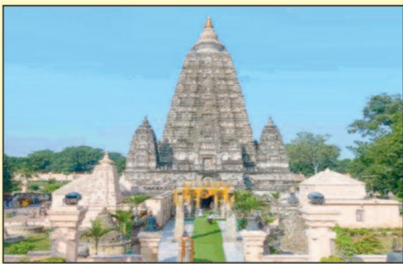
महाबोधि मंदिर, बोधगया

कुतुब मीनार दिल्ली में स्थित एक 5-मंजिला लाल बलुआ पत्थर की मीनार है। इसे 12वीं शताब्दी में कुतुबुद्दीन ऐबक ने बनवाया गया था और इसे दुनिया की सबसे ऊंची मीनार के रूप में जाना जाता था। यह दिल्ली के सबसे पुराने स्मारकों में से एक है और इसे यूनेस्को विश्व धरोहर स्थल भी घोषित किया गया है। दिल्ली में यह महरीली में स्थित है, जो पर्यटकों को सालों से आकर्षित करता आया है।