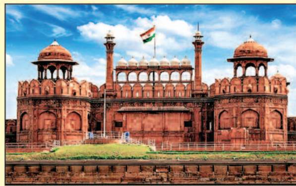
लाल किला, दिल्ली

हम्पी, कर्नाटक में स्थित एक यूनेस्को विश्व धरोहर स्थल है और यह विजयनगर साम्राज्य की राजधानी हुआ करती थी। यहां के खंडहर, मंदिर, महल और अन्य संरचनाएं भारत के मध्यकालीन इतिहास की झलक पेश करते हैं। हम्पी में विजयनगर साम्राज्य की वास्तुकला और संस्कृति का अनुभव लेने के लिए उत्तम जगह है।