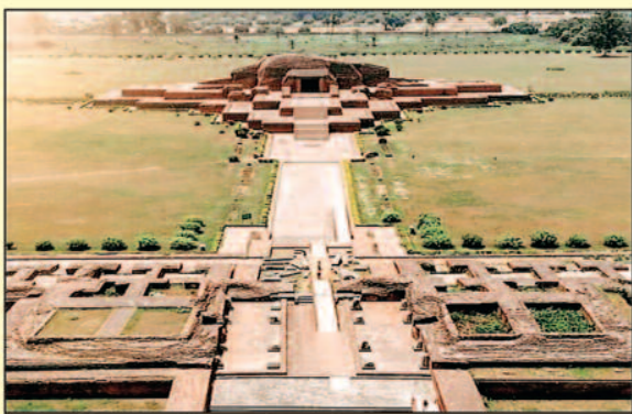
विक्रमशिला विश्वविद्यालय, बिहार

महाबलिपुरम, तमिलनाडु में स्थित एक यूनेस्को विश्व धरोहर स्थल है और यह पल्लव साम्राज्य का एक प्रमुख बंदरगाह था। यहां के रथ मंदिर, गुफा मंदिर और समुद्र तट मंदिर भारत की दक्षिण भारतीय वास्तुकला का उत्कृष्ट उदाहरण हैं। महाबलिपुरम समुद्र तट पर सूर्यास्त देखना कभी न भूलाने वाला अनुभव है।