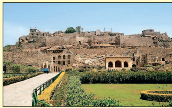
गोलकुंडा किला, हैदराबाद

कोणार्क सूर्य मंदिर, ओडिशा में स्थित एक यूनेस्को विश्व धरोहर स्थल है और यह एक विशाल रथ के रूप में बनाया गया है। यह मंदिर सूर्य देव को समर्पित है और इसकी नक्काशी और शिल्पकला अपने आप में बेहद अनूठा है। भारत की प्राचीन वास्तुकला और संस्कृति का अनुभव लेने के लिए कोणार्क सूर्य मंदिर सबसे बेस्ट जगह है।