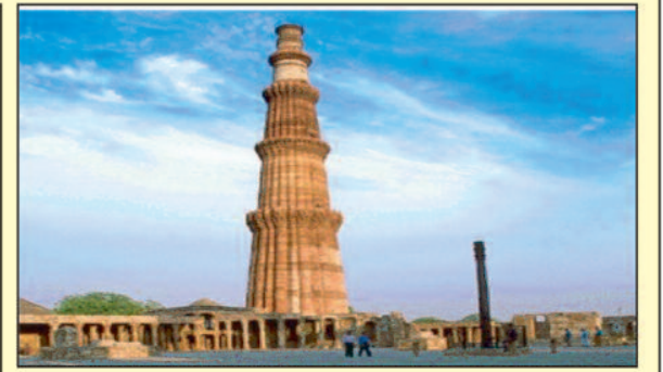
कुतुब मीनार, दिल्ली

ताजमहल, भारत के सबसे प्रसिद्ध स्मारकों में से एक है और इसे दुनिया के सात अजूबों में से एक के रूप में भी मान्यता प्राप्त है। इसे मुगल सम्राट शाहजहां ने अपनी पत्नी मुमताज महल की याद में बनवाया गया था। इसकी सफेद संगमरमर का आकर्षक डिजाइन और नक्काशी दुनिया भर में मशहूर है, जिसे देखने दुनिया के हर कोने से पर्यटक आते हैं।