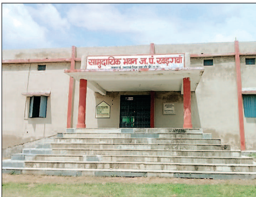
प्रतीक्षालय निर्माण पेयजल कार्य भवनों के रंगरोगन के लिए लाखों रूपए तो आहरण किये गए लेकिन धरातल

मनेन्द्रगढ़ चिरमिरी भरतपुर विकासखण्ड खडगाँव मुख्यालय के ग्राम पंचायत खडगाँव में सूत्रों से जानकारी मिल रही है कि सरपंच-सचिव द्वारा सामुदायिक भवन पोताई एवं मरम्मत के नाम पर लाख रुपए का घोटाला करने का मामला सामने आया है। इसके अतिरिक्त भी कई निर्माण कार्य स्ट्रीट लाइट पेयजल ग्राम कि साफ सफाई व्यवस्था के नाम पर भी पंचायत मदो के लाखों रूपए की राशि का मनमाने तरीके से आहरण कर लिया गया, जबकि गाँव में कुछ भी कार्य नहीं हुए है और जो काम कराए गए हैं वह भी आधा-अधुरे दिखाई दे रहे हैं। स्थानीय ग्रामीणों ने संबंधित अधिकारियों से जांच कराने की मांग की है। खडगाँव ग्राम पंचायत के ग्रामीणों ने बताया कि ग्राम सरपंच व सचिव के मिलीभगत से सामुदायिक भवन पोताई और मरम्मत कराने पांच लाख रूपए की राशि स्वीकृत हुई थी लेकिन सामुदायिक भवन के मरम्मत कार्य को सिर्फ लोपा पोती कराया गया है। ग्रामीणों का आरोप है कि ग्राम पंचायत के विकास हेतु पंचायत में विभिन्न योजनाओं एवं मदों कि राशि से नाली निर्माण,