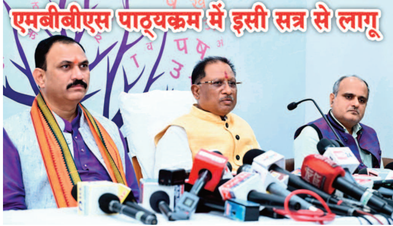
हिन्दी को बढ़ावा

रायपुर, 14 सितम्बर 2024(ए।) मुख्यमंत्री विष्णु देव साय ने हिन्दी दिवस पर बड़ी घोषणा करते हुए राज्य के सभी चिकित्सा महाविद्यालयों में हिन्दी में भी पढ़ाई शुरू करने की बात कही है। मुख्यमंत्री ने राजधानी स्थित अपने निवास कार्यालय में स्वास्थ्य मंत्री श्याम बिहारी जायसवाल की उपस्थिति में पत्रकारों से बात करते हुए इसकी घोषणा की। सीएम ने कहा कि हमारी सरकार ने यह निर्णय लिया है कि एमबीबीएस की पढ़ाई की व्यवस्था भी हम हिन्दी में करेंगे। इस साल के प्रथम सत्र 2024-25 में एमबीबीएस की पढ़ाई की सुविधा हिन्दी में भी उपलब्ध होगी। इसके लिए छात्र छात्राओं की संख्या अनुरूप आवश्यक पुस्तक उपलब्ध कराने के निर्देश स्वास्थ्य विभाग को दिए गए हैं।