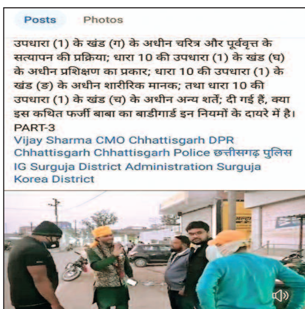
बाबा का काफिला

स्वघोषित बाबा पूर्व निर्वाचित जनप्रतिनिधियों के साथ पोस्टर भी शहर गांव में लगवा रहा है।उसके पोस्टर एक राजनीतिक दल विशेष के पूर्व निर्वाचित जनप्रतिनिधियों के साथ शहर गांव में नजर आ रहे हैं। पोस्टर देखकर यह सवाल भी उठता है की बाबा इलाज वाला बाबा है या राजनीतिक दल का वह सदस्य है प्रचारक है। हाल ही में स्वघोषित बाबा के पोस्टर बैकुंठपुर,पटना,सोनहत में नजर आए जिसमें उन पूर्व निर्वाचित जनप्रतिनिधियों की तस्वीरें थीं साथ उसके जो एक दल विशेष से संबंध रखते हैं।