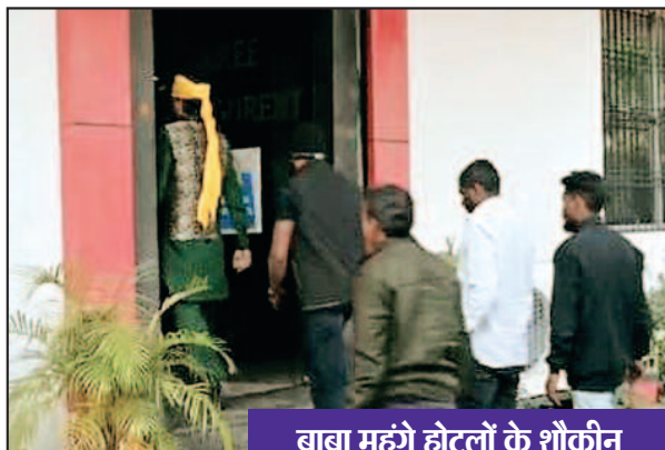
बाबा महंगे होटलों के शौकीन

पार्ट 2 बनना चाह रहा है यह भी लिखने वाले ने सोशल मिडिया पर लिखा है। बाबा के दरबार की विडियो भी सोशल मिडिया पर साझा की जा रही है और बताया जा रहा है की बाबा किस तरह लोगों का दावा दर्द दूर कर रहे हैं बाबा से उनके दरबार में लोग कह रहे हैं उनके पूछने पर की उन्हे उनकी तकलीफ से मुक्ति मिल रही है। बता दें की नीम हकीम और बाबाओं का चक्र यह बतलाता है की स्वास्थ्य व्यवस्था का बुरा हाल है और लोग इसी वजह से बाबाओं के गिरफ्त में जा रहे हैं। बता दें सोशल मिडिया में जिसने मामले को उठाया है उसने शासन प्रशासन से मांग भी साथ साथ की है की अंधविश्वास का यह खेल बंद कराए प्रशासन। वैसे सोशल मिडिया पर इसका विरोध दर्ज करने वाले की मांग जायज है क्योंकि यदि बाबाओं के पास ही गंभीर बीमारियों का इलाज है अस्पतालों में नहीं तो फिर क्यों लोग अस्पताल जायेंगे वहीं यदि ऐसा नहीं है तो ऐसे बाबाओं के ऊपर कड़ी कानूनी कार्यवाही करने की जरूरत है और कार्यवाही भी ऐसी जो नजोर बन सके और कोई भी बाबा बनकर लोगों को बेवकूफ बनाने का प्रयास न करे। वैसे बाबाओं के चक्र में कई बार लोग जान से भी हाथ धो बैठते हैं क्योंकि वह इलाज को उन्हे