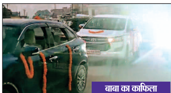
बाबा का काफिला

उठना लाजमी भी है और वहीं लोग अब नीम हकीम के पास जाना बेहतर समझ रहे हैं और उसी कारण नीम हकीमों का व्यवसाय भी अच्छा खासा चल रहा है। कोरिया जिले के पटना क्षेत्र में इसी तरह एक नीम हकीम का पदार्पण हुआ है जो दरबार लगा रहा है और लोगों का इलाज कर रहा है वह भी गंभीर बीमारियों का इलाज। बताया जा रहा है वहीं बाबा का भी दावा है की वह सभी बीमारियों का दरबार में इलाज करता है। बाबा युवा है और वह पहले स्वास्थ्य विभाग की महतारी एक्सप्रेस का चालक था यह बताया जा रहा है और एकाएक वह वाहन चालक से बाबा बन गया वह भी इलाज वाला। बता दें की बाबा को लेकर कुछ लोगों ने सोशल मीडिया में यह भी लिखा है की बाबा बना युवक एंबुलेंस चलाते चलाते ज्ञान पा गया और बाबा बन गया वहीं वह बागेश्वर