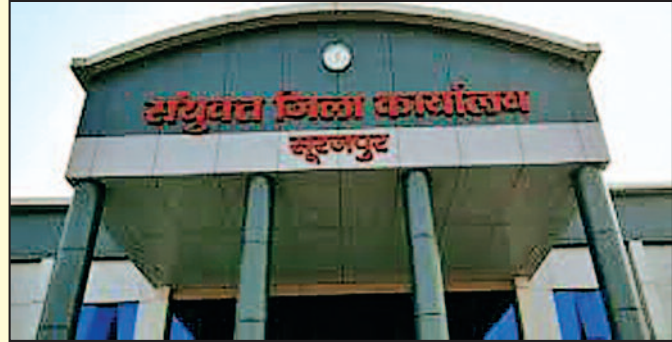
-संवाददाता- सूरजपुर, 12 जून 2024 (घटती-घटना)।

भू-राजस्व संहिता के विपरीत आखिर क्यों चलाते हैं राजस्व अधिकारी क्या इन्हें नहीं है किसी कार्यवाही भय