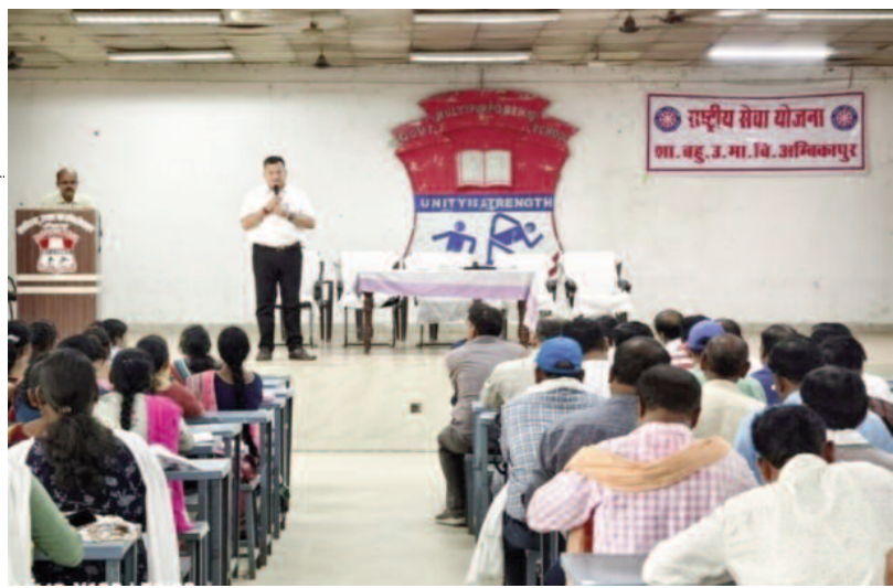
बैठक में जिले के जर्जर स्थिति वाले विद्यालय की जानकारी ली गई ताकि डिस्ट्रिक्ट की कार्यवाही की जा सके। शाला प्रवेश उत्सव हेतु शाला परिसर एवं भवन की साफ-

जिला शिक्षा अधिकारी की अध्यक्षता में शुक्रवार को दो पालियों में शासकीय बहुउद्देशीय उमावि अम्बिकापुर, में समस्त शासकीय उमावि और हाई स्कूल के प्राचार्यों और सर्व विकासखण्ड शिक्षा अधिकारी, सहायक विकासखण्ड शिक्षा अधिकारी, वीआरसीसी एवं सीएसी की बैठक आयोजित की गई। बैठक में सत्र 2023-24 परीक्षा में कक्षा 10वीं एवं 12वीं के परीक्षा परिणाम, सत्र 2024-25 में हाई स्कूल/हायर सेकेंडरी स्कूल में अच्छे प्रदर्शन करने हेतु कार्य योजना पर चर्चा की गई।