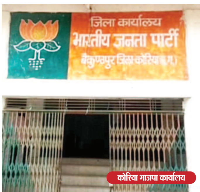
कोरिया भाजपा कार्यालय

लिए खुद का नेतृत्व बतलाया जा रहा था जबकि सच्चाई यह है कि उनके नेतृत्व में कोरिया भाजपा में जबरजस्त आक्रोश व्याप्त है। और पार्टी छिन्न भिन्न हो गई है।