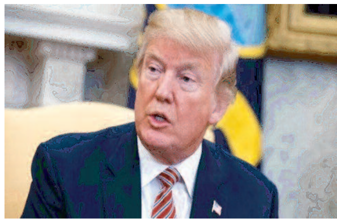
खिलाफ चलाए जा रहे इस मुकदमे को अपमानजनक और धांधलीपूर्ण बताया। उन पर साल 2016 में व्हाइट हाउस में आने से पहले पूर्व पॉन स्टार स्टॉर्मी डेनियल्स के साथ अपने यौन संबंधों को छिपाने के लिए व्यापारिक रिकॉर्ड में हेराफेरी करने का आरोप है। इस मामले में 34 आरोप, 11 चालान, 12 वाउचर

में चीन ने लंबे समय से अपनी राजनीतिक प्रणाली को अमेरिकी लोकतंत्र से बेहतर के रूप में पेश करने की कोशिश की है। अब ट्रंप की सजा ने इसे कहीं न कहीं साबित कर दिया है। दरअसल, कई महीनों से चीनी प्रचारक ट्रंप की कानूनी चुनौतियों को लेकर सवाल खड़े कर रहे हैं। मामले को एक खास मुद्दा बनाकर वह अमेरिका के खिलाफ बीजिंग की चाल को मजबूत करने की कोशिश कर रहे हैं। इतना ही नहीं, बल्कि लंबी कानूनी लड़ाई को अमेरिकी राजनीति में ध्वविकरण का सबूत बता रहे हैं।