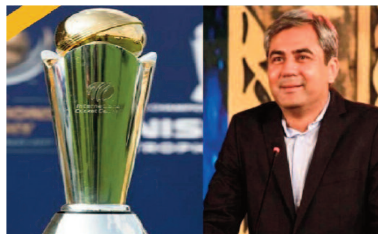
ने टूर्नामेंट के सभी मैच श्रीलंका की मेजबानी में खेले थे, इसके अलावा एशिया कप के नॉकआउट मैच भी श्रीलंका में ही खेले गए थे। वहीं एक ताजा रिपोर्ट के अनुसार पीसीबी किसी भी तरह के प्लान बी की तैयारी नहीं कर रहा है।

शुक्ला ने कहा था कि चैंपियंस ट्रॉफी के लिए टीम इंडिया का पाकिस्तान जाना सरकार के फैसले पर निर्भर करेगा। हालांकि, बावजूद पाकिस्तान किसी भी तरह के प्लान बी की तरफ नहीं देख रहा है। जैसे 2023 में खेला गया एशिया कप हाइब्रिड मॉडल में हुआ था। पाकिस्तान उस तरह का कोई प्लान नहीं बना रहा है। बता दें कि, एशिया कप 2023 की मेजबानी भी पाकिस्तान के पास थी, लेकिन टीम इंडिया ने टूर्नामेंट के लिए पाकिस्तान का दौरा नहीं किया था। टीम इंडिया के इंडिकर के बाद एशिया कप को हाइब्रिड मॉडल के तहत करवाया गया था। भारतीय टीम