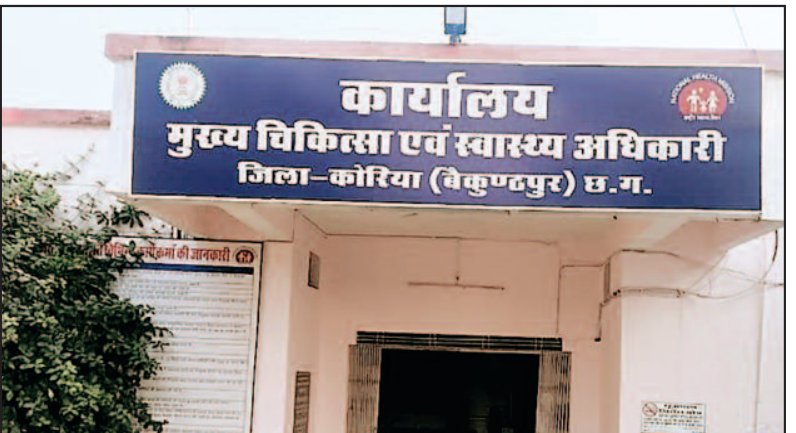
बीते दो वर्षों में जमकर वित्तीय अनियमितताएं प्रशासन के शह पर जांच में लिपापोती की जा बरती गयी है, कई शिकायतों के बाद जिला रही है। सूत्रों की माने में सीएमएचओ

-ओंकार पाण्डेय- कोरिया/सूरजपुर,29 मई 2024 (घटती-घटना)। कोरिया जिले के स्वास्थ्य विभाग में अब भी पूर्व डीपीएम का जलवा बरकरार है,सूत्र बताते है कि योजना रात में सीएमएचओं कार्यालय में अपने खिलाफ हो रही जांच की रिपोर्ट सीएमएचओ और पूर्व डीपीएम खुद बना रहे है,इसके लिए तमाम दस्तावेजों को कालापीला करने में सहायक लेखापाल को लेकर बंद कमरों में कलाकारी जारी है पूरा काम बेहद गुप्त तरीके से किया जा रहा है ताकि विभाग के किसी भी कर्मचारी तक को इसकी भनक नही लग सके। कोरिया जिले के सीएमएचओ कार्यालय में