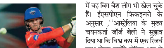
तीन स्थानों के लिये डेविड वॉर्नर, ट्रेविंस हेड और कप्तान मिचेल मार्श पहले से हैं। बल्लेबाजी हरफनमौला शॉर्ट ने ऑस्ट्रेलिया के लिये पिछले 14 में से नौ टी 20 मैच खेले हैं। इनमें से पांच में उन्होंने पारी का आगाज किया और पिछले दो सत्र में वह बिग बैश लीग भी खेल चुके हैं।

मेलबर्न, 20 मई 2024। आक्रामक बल्लेबाज जैक फ्रेजर मैकगर्क और मैथ्यू शॉर्ट एक जुन से अमेरिका और वेस्टइंडीज में होने वाले टी20 विश्व कप के लिये ऑस्ट्रेलिया के रिजर्व खिलाड़ी होंगे। बाईस वर्ष के मैकगर्क ने आईपीएल में दिल्ली कैपिटल्स के लिये शानदार प्रदर्शन किया है। अभी तक टी 20 अंतरराष्ट्रीय क्रिकेट में पदाग्रत नहीं कर सके मैकगर्क को टी 20 विश्व कप टीम में जगह नहीं मिली है क्योंकि ऑस्ट्रेलिया के पास शॉर्ट