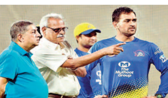
उन्होंने क्रिकबज से बातचीत में कहा कि, धोनी ने उन्हें कुछ नहीं बताया है। माही अक्सर अपने निर्णय अचानक ही लेते हैं। पहले भी उन्होंने ऐसा किया है। माही ने साल 2019 में 15 अगस्त के दिन अचानक इंटरनेशनल क्रिकेट को अलविदा कह दिया था। विश्वानाथन ने कहा कि, वैसे भी वो हमें ऐसी बातें नहीं बताते हैं, बस वह निर्णय ले लेते हैं। एमएस धोनी की फिटनेस भी शायद साथ नहीं दे रही है। इस आईपीएल सीजन भी वह घुटने के दर्द से परेशान रहे थे। सीएसके के मुख्य कोच स्टीफन फ्लेमिंग समेत कई टीम सदस्यों ने भी ये स्वीकार किया था कि धोनी लगातार दर्द से जूझ रहे हैं बावजूद इसके उन्होंने पूरा सीजन खेला है।

नई दिल्ली, 20 मई 2024। आईपीएल 2024 में चेन्नई सुपर किंग्स का सफर आरसीबी के हाथों मिला हार के साथ ही खत्म हो गया है। वहीं अब फैंस के मन में बड़ा सवाल है कि क्या एमएस धोनी का ये आखिरी मैच था? क्योंकि धोनी के भविष्य को लेकर हर जगह चर्चा है। इसी कड़ी में सीएसके के सीईओ काशी विश्वानाथन ने खुलासा किया है। दरअसल, सीईओ काशी विश्वानाथन भी धोनी के संन्यास को लेकर अभी तक अंजान हैं।