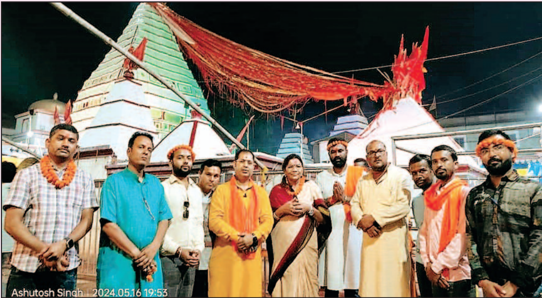
—संवाददाता— मनेन्द्रगढ़, 20 मई 2024 (घटती-घटना)।