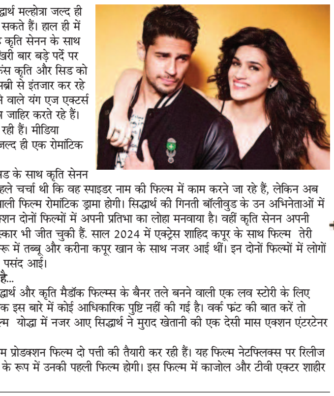
कई देशभक्ति फिल्मों के बाद सिद्धार्थ मल्होत्रा जल्द ही एक रोमांटिक फिल्म में नजर आ सकते हैं। हाल ही में एक रिपोर्ट में कहा गया है कि वह कृति सैनन के साथ स्क्रीन पर नजर आएंगे। उन्हें आखिरी बार बड़े पर्दे पर फिल्म योद्धा में देखा गया था। फैंस कृति और सिद्ध को एक साथ फिल्म में देखने का बेसब्री से इंतजार कर रहे हैं। रेड कार्पेट पर हमेशा स्पोर्ट होने वाले यंग एज एक्टर्स अक्सर साथ काम करने की इच्छा जाहिर करते रहे हैं। आखिरकार उनकी इच्छा पूरी हो रही है। मीडिया रिपोर्ट्स का दावा है कि सिद्धार्थ जल्द ही एक रोमांटिक फिल्म में नजर आएंगे। बताया जा रहा है कि फिल्म में सिद्ध के साथ कृति सैनन मुख्य भूमिका में नजर आएंगी। पहले चर्चा थी कि वह साइडर नाम की फिल्म में काम करने जा रहे हैं, लेकिन अब कहा जा रहा है कि उनकी आने वाली फिल्म रोमांटिक ड्रामा होगी। सिद्धार्थ की गिनती बॉलीवुड के उन अभिनेताओं में होती है जिन्होंने रोमांटिक और एक्शन दोनों फिल्मों में अपनी प्रतिभा का लोहा मन्वाया है। वहीं कृति सैनन अपनी एक्टिंग के लिए राष्ट्रीय फिल्म पुरस्कार भी जीत चुकी हैं। साल 2024 में एक्ट्रेस शाहिद कपूर के साथ फिल्म तेरी बातों में ऐसा उलझा जिया और वरु में तब्बू और करीना कपूर खान के साथ नजर आई थीं। इन दोनों फिल्मों में लोगों को उनकी कॉमिक टार्विंग काफ़ी पसंद आई। आधिकारिक पुष्टि का इंतजार है... मीडिया रिपोर्ट्स के मुताबिक, सिद्धार्थ और कृति मैडॉक फिल्मस के बैनर तले बनने वाली एक लव स्टोरी के लिए साथ आ रहे हैं। हालांकि, अभी तक इस बारे में कोई आधिकारिक पुष्टि नहीं की गई है। वर्क फ्रंट की बात करें तो आखिरी बार करण जौहर की फिल्म योद्धा में नजर आए सिद्धार्थ ने मुराद खेतानी की एक देसी मास एक्शन एंटरटेनर फिल्म भी साइन की हैं। दूसरी ओर, कृति अपनी पहली होम प्रोडक्शन फिल्म दो पत्नी की तैयारी कर रही हैं। यह फिल्म नेटफ्लिक्स पर रिलीज होगी और यह फिल्म एक निर्माता के रूप में उनकी पहली फिल्म होगी। इस फिल्म में काजोल और टीवी एक्टर शाहीर शेख मुख्य भूमिका निभा रहे हैं।