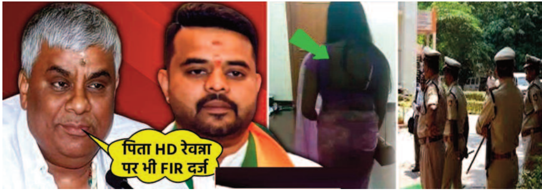
पिता HD रेवन्ना पर भी FIR दर्ज