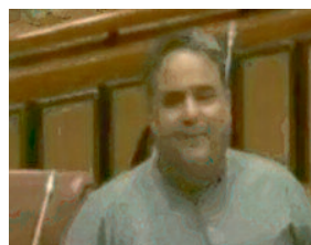
इस्लामाबाद, 01 मई 2024।