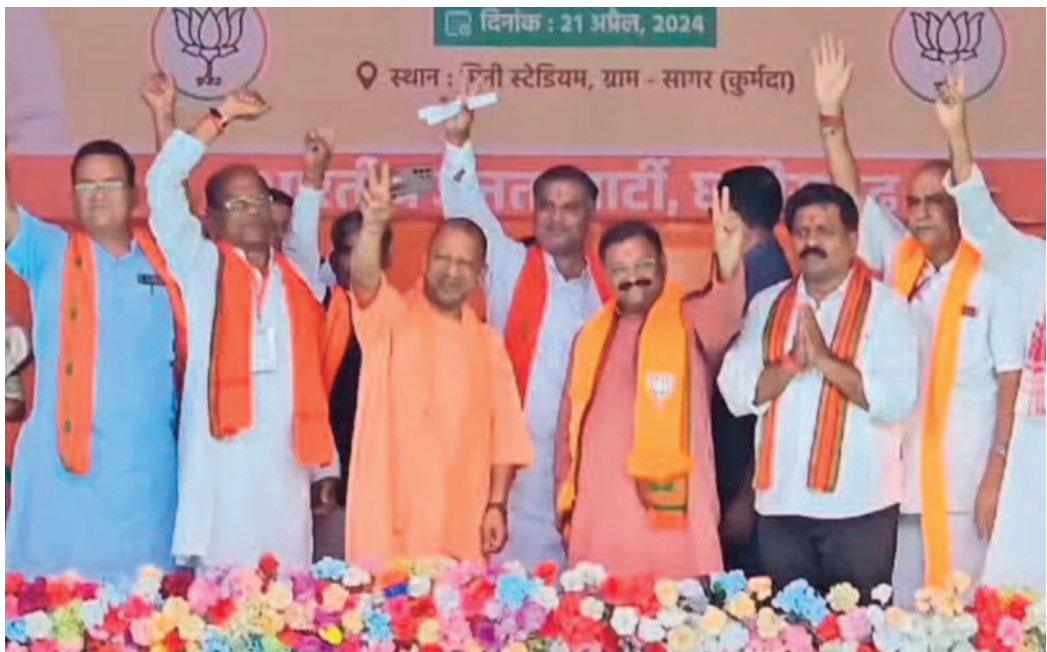
को आतंकवाद के नाम पर, उग्रवाद के नाम पर उकसाने का कार्य किया है। योगी ने कहा पहले फेज में 102 लोकसभा सीटों पर चुनाव हुए हैं। पूरे देश के अंदर एक ही लहर है, एक ही आवाज है फिर एक बार मोदी सरकार। जो लोग जातिवाद के नाम

राजनांदगांव, 21 अप्रैल 2024 (ए)। उत्तर प्रदेश के मुख्यमंत्री योगी आदित्यनाथ ने कहा है कि कांग्रेस घोटाले का नाम है, कांग्रेस आतंकवाद का नाम है, कांग्रेस नक्सलवाद का नाम है। कांग्रेस ने युवाओं को आतंकवाद के नाम पर, उग्रवाद के नाम पर उकसाने का कार्य किया है। योगी ने कहा पहले फेज में 102 लोकसभा सीटों पर चुनाव हुए हैं। पूरे देश के अंदर एक ही लहर है, एक ही आवाज है फिर एक बार मोदी सरकार। जो लोग जातिवाद के नाम