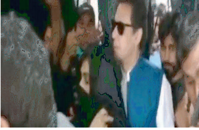
बता दें कि शीकत खानम अस्पताल पूर्व प्रधानमंत्री इमरान खान के