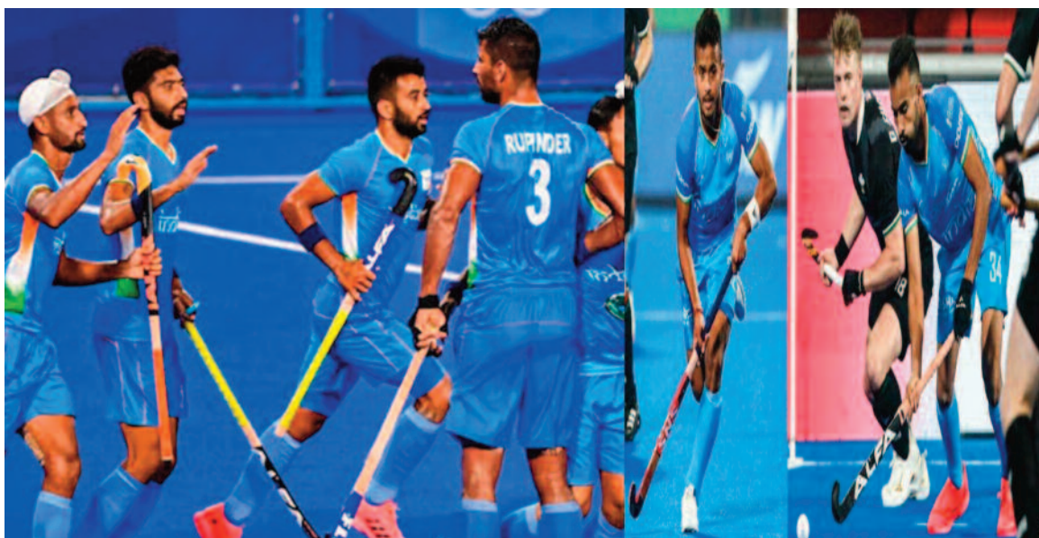
रणनीति पर प्रभावी अमल करके देने पर होगा। भारत ने आखिरी बाद फरवरी में एफआईएच प्रो लीग में शानदार प्रदर्शन के बाद भारतीय टीम आत्मविश्वास दोषहर दो बजे से शुरू होगा।

पेरिस ओलंपिक से पहले आस्ट्रेलिया की चुनौती के लिये तैयार भारतीय हॉकी टीम