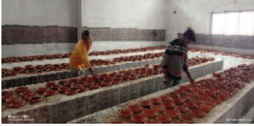
- संवाददाता - अम्बिकापुर, 08 अप्रैल 2024 (घटती-घटना)।

उन्होंने बताया कि महामाया मंदिर में कुल 46 सौ से ज्यादा ज्योति कलश प्रज्वलित किए जाने की उम्मीद है। वहीं गांधी चौक स्थित दुर्गा मंदिर में भी चार हजार के करीब ज्योति कलश प्रज्वलित होने का अनुमान है। मनोकामना ज्योति कलश का रशीद कटाने भक्त शहर सहित काफी दूर-दूर से पहुंच रहे हैं। महामाया मंदिर में सुबह की आरती 5.15 बजे व शाम की आरती 7.30 बजे होगी। महामाया मंदिर में नवरात्रि के पहले दिन काफी संख्या में श्रद्धालुओं के पहुंचने का उम्मीद है। इसे लेकर मंदिर समिति द्वारा तैयारी कर ली गई है। श्रद्धालुओं को मां के दर्शन के लिए अपनी बारी का इंतजार करना पड़ेगा। लोग कतार में खड़े होकर मां के दर्शन कर पाएंगे। दर्शन के दौरान श्रद्धालुओं को किसी तरह की कोई परेशानी न हो, इसके लिए मंदिर समिति द्वारा पूरी तैयारी की गई है। महामाया मंदिर के पुजारी ने बताया कि इस वर्ष पूरे 9 दिनों की नवरात्रि है। इस वर्ष मां महामाया के दर्शन-पूजन मंदिर परिसर के