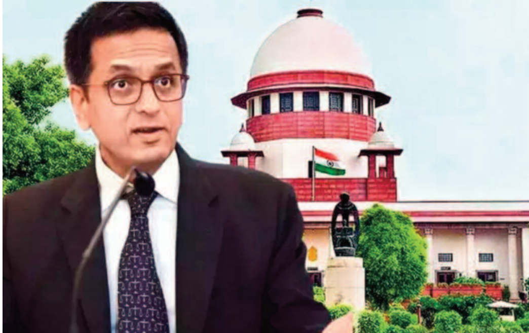
बिष्कूल अलग है। बोर्ड का गठन हो चुका है और इसमें ढांचागत बदलाव की जरूरत है। सीजेआई डी वाई चंद्रचूड ने कहा था

सुप्रीम कोर्ट भारतीय तटरक्षक बल को एक महिला अधिकारी की याचिका पर सुनवाई कर रही थी, जिसमें बल की योग्य महिला शॉर्ट-सर्विस कमीशन अधिकारियों को स्थायी कमीशन देने की मांग की गई है। अर्दोंनी जनरल आर वेंकटरमणी ने कहा था कि तटरक्षक बल नौसेना और सेना से