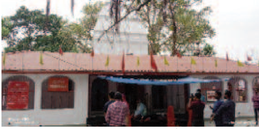
- संवाददाता - अम्बिकापुर, 08 अप्रैल 2024 (घटती-घटना)।

चैत्र नवरात्रि शुरूआत मंगलवार से हो रही है। इस वर्ष पूरे नौ दिनों की नवरात्रि है। नवरात्रि की समाप्ति 17 अप्रैल को होगी। नवरात्रि को लेकर देवी मंदिरों में तैयारी पूर्ण कर ली गई है। नवरात्र के पहले दिन से ही देवी मंदिरों में मातारानी के दर्शन के लिए भक्तों का रेला उमड़गा।