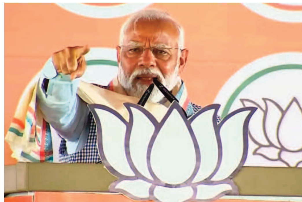
दुनिया में कोविड का महसूसकत आया, लोग कहते थे कि भारत कैसे बचेगा ?

प्रधानमंत्री नरेंद्र मोदी ने कहा कि छत्तीसगढ़ के कांग्रेसी मोदी का सिर फोड़ने की धमकी दे रहे हैं। मोदी इन धमकियों से डरने वाला नहीं है। आप ही बताएं गरीबों को जिन्होंने लूट उठें सजा मिलनी चाहिए की नहीं। मोदी ने भ्रष्टाचार खत्म किया उन्होंने बचाने का काम किया। वे छत्तीसगढ़ में जगदलपुर के आमाबाल गांव में चुनावी सभा को संबोधित किया। बस्तर लोकसभा सीट से भाजपा उम्मीदवार महेश कश्यप हैं। यह इलाका भाजपा के दिवंगत नेता बलिराम कश्यप और कश्यप परिवार का कहा जाता है। यहां के युवाओं को जिसने धोखा दिया है। उनकी तेजी से जांच हो रही है। यहां के कांग्रेसी मोदी का सिर फोड़ने की धमकी दे रहे हैं। मोदी इन धमकियों से डरने वाला नहीं है। आप ही बताएं गरीबों को जिन्होंने लूट उठें सजा मिलनी चाहिए की नहीं। मोदी ने भ्रष्टाचार खत्म किया उन्होंने बचाने का काम किया। मैंने 3 करोड़ बहने को लखपति बनाने का फैसला किया है। आदिवासी समाज का उत्थान करना है। छत्तीसगढ़ में सबसे ज्यादा एकलव्य कॉलेज है। जिसको किसी ने नहीं पूछा उसे मोदी ने पूजा है। 24 हजार करोड़ की पीएम जन मन योजना शुरू की गई। इससे आदिवासियों के जीवन को बेहतर बनाया जाएगा। मेरा लक्ष्य देश को विकसित बनाना है। यहां के पूरे परिवार को विकसित बनाना है।