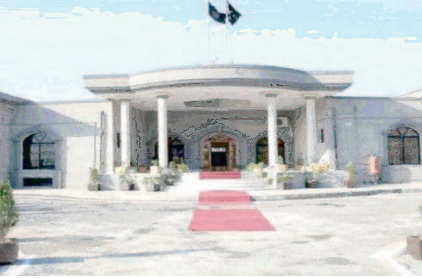
फारूक ने मामले की सुनवाई की। उन्होंने कहा, किसी से मिलने का अधिकार नहीं छीना जा सकता है। शर्तें तय करने में कोई

इस्लामाबाद, 27 मार्च 2024। इस्लामाबाद हाई कोर्ट (आईएचसी) ने बुधवार को जेल में बंद पूर्व प्रधानमंत्री इमरान खान की पाकिस्तान तहरीक-ए-इंसाफ (पीटीआई) द्वारा इस्लामाबाद में रैली का आयोजन करने वाली याचिका को स्वीकार कर ली है। अदालत ने अधिकारियों को कानून के तहत पार्टी को रैली का आयोजन करने का आदेश भी दिया। अप्रैल में होगा रैली का आयोजन इस्लामाबाद हाई कोर्ट ने पीटीआई द्वारा एक रैली आयोजित करने के मामले पर सुनवाई की। पार्टी इस रैली का आयोजन 23 या 30 मार्च को करना चाहती थी, लेकिन बाद में उन्होंने इसे छह अप्रैल को आयोजित करने का फैसला किया। जिला प्रशासन द्वारा अनुमति देने से इनकार करने के बाद पार्टी ने अदालत का दरवाजा खटखटाया था। आईएचसी के मुख्य न्यायाधीश आमेर