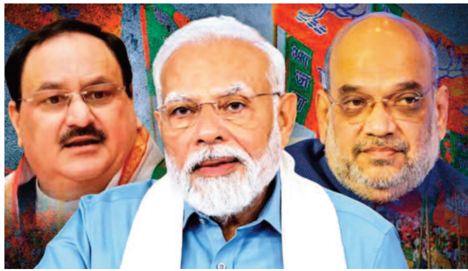
गडकरी नागपुर से, पीयूष गोयल मुंबई नॉर्थ से लड़ेंगे... हरियाणा के पूर्व सीएम करनाल से कैडिडेट

नई दिल्ली, 13 मार्च 2024 (ए)। लोकसभा चुनाव के लिए बुधवार को शाम भाजपा की दूसरी लिस्ट जारी हुई। इसमें 72 नाम हैं। नागपुर से