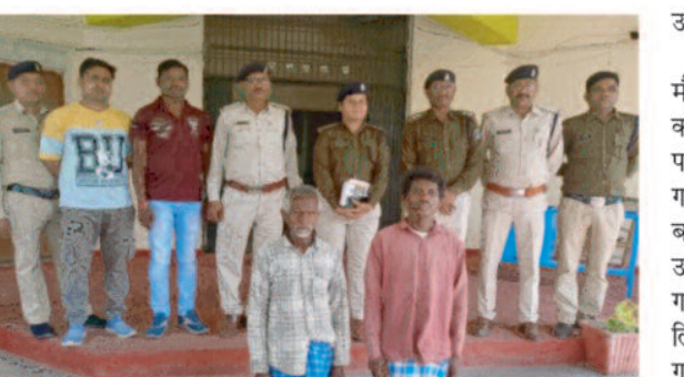
मामले की सूचना के बाद मां कायम कर शव को तालाब से बाहर निकाला गया और विवेचना शुरू की गई।