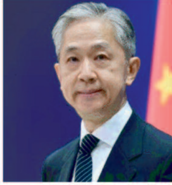
वास्तविक नियंत्रण रेखा (एलएससी) पर इतनी अधिक सेनाएं नहीं होंनी चाहिए।

वांग ने कहा कि चीन ने कई बार इस बात पर जोर दिया है कि सीमा विवाद कभी भी पूरे चीन-भारत संबंधों को नहीं दर्शाता है। बता दें सोमवार को चीनी राजनयिक के सवाल का जवाब देते हुए जयशंकर ने कहा था कि मुझे लगता है कि यह हमारे साझा हित में है कि