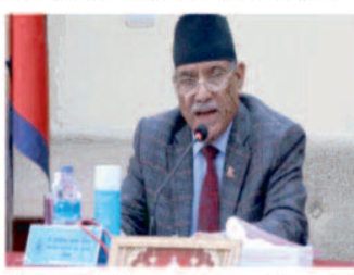
सीपीएन-यूएमएल ने विश्वास मत जीत लिया है।

काठमांडू, 13 मार्च 2024। नेपाली कांग्रेस को छोड़ने और नेपाल की कम्युनिस्ट पार्टी-यूनिफाइड मार्क्सिस्ट-लेनिनिस्ट (सीपीएन-यूएमएल) के साथ नया गठबंधन बनाने के कुछ दिनों के बाद प्रधानमंत्री पुष्प कमल दहल प्रचंड बुधवार को संसद में अपना विश्वास मत हासिल कर लिया है। उन्हें 275 सदस्यीय प्रतिनिधि सभा में 157 वोट मिले। मतदान के दौरान काठमांडू के नया बानेश्वर स्थित संसद भवन में मतदान के दौरान 268 सांसद मौजूद थे। उनमें से 110 वोट उनके खिलाफ और 138 वोट उनके पक्ष में पड़े।