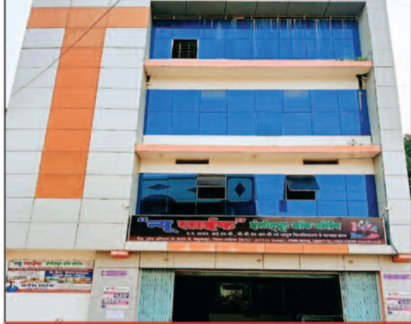
न्यू लाइफ इंस्टीट्यूट ऑफ नर्सिंग

क्या नियम विरुद्ध तरीके से संचालित हो रहा है न्यू लाइफ इंस्टीट्यूट ऑफ नर्सिंग ? कार्यवाही के लिए जांच प्रतिवेदन भेजा गया संचालनालय