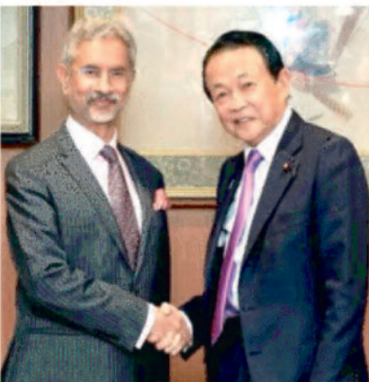
हिंद-प्रशांत क्षेत्र में स्थिरता के मुद्दे पर भी जापान को स्वाभाविक भागीदार के रूप में देखा है। उन्होंने कहा कि 2023 द्विपक्षीय संबंधों में

भारत और जापान का रिश्ता अहम; 2023 द्विपक्षीय संबंधों का ऐतिहासिक साल डॉ. जयशंकर ने कहा कि भारत अपनी विकास यात्रा के साथ-साथ