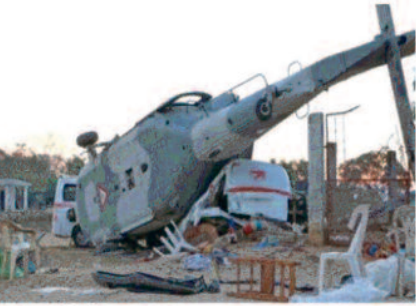
मादक पदार्थों की तस्करी से जुड़ी हिंसा से प्रभावित है।

मैक्सिको सिटी, 07 मार्च 2024 मैक्सिकन नौसेना के हेलीकॉप्टर दुर्घटनाग्रस्त होने से कम से कम तीन सदस्यों की मौके पर मौत हो गई। नौसेना मंत्रालय ने कहा कि यह दुर्घटना पश्चिमी मिचोआकेन राज्य में लाजारा कडेंस बंदरगाह से 370 किमी दक्षिण पश्चिम में हुई। मंत्रालय ने एक बयान में कहा कि नौसेना का हेलीकॉप्टर फ्लाइट डेक से उड़ान भरने के तुरंत बाद