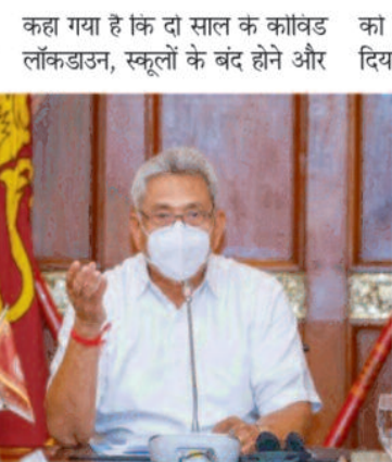
रोजगार के नुकसान के बाद जीवनयापन की लागत बढ़ गई है। मैं अपने कारण लोगों को लंबे समय तक राजनीतिक गतिरोध में नहीं डालना चाहता था।

लोगों को रहत देने के लिए दिया था इस्तीफा: गोटाबाया पूर्व राष्ट्रपति ने किताब में कहा कि फिर भी मैंने श्रीलंका के लोगों को कुछ राहत देने के लिए राष्ट्रपति पद से इस्तीफा दे दिया। किताब में