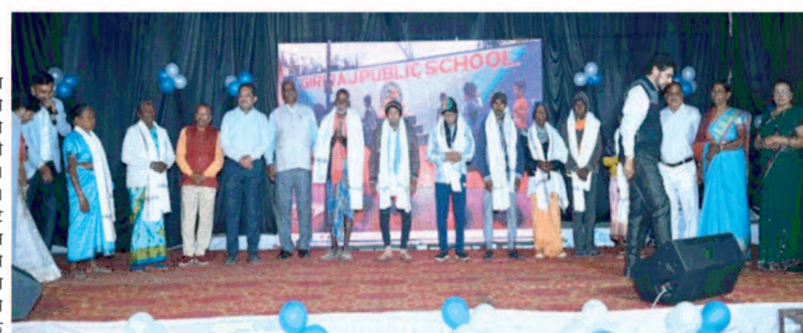
आंखों में भावनाओं के आंसू भर दिए। इस कार्यक्रम का पेरेंटिंग एक्ट भी दर्शकों के बीच में चर्चा का विषय रहा। इसके द्वारा आज के दौरे में बच्चे और अभिभावकों के बीच किस् तरह के संतुलन की जरूरत है इसका मैसेज दिया गया। बच्चों ने दोनों के बीच की

शहर के गिरिराज पब्लिक स्कूल का वार्षिकोत्सव रविवार को अनोखे ढंग से मनाया गया। यह विद्यालय अपने अनोखे प्रयोग की वजह से हमेशा ही वार्षिकोत्सव की मुख्य थीम संस्कार थी। इस कार्यक्रम में विद्यालय के छोटे-छोटे बच्चों ने विभिन्न प्रकार के कार्यक्रम प्रस्तुत किए। जिसमें मुख्य रूप से विद्यालय के बच्चों के दादा-दादी, नाना नानी के साथ ही अम्बिकापुर वृद्धाश्रम से आए हुए बुजुर्गों का तिलक व आरती के द्वारा सम्मान किया गया। साथ ही मुख्य अतिथि द्वारा उन्हें शाल भेंट की गई। इस कार्यक्रम ने वहां उपस्थित सभी लोगों की