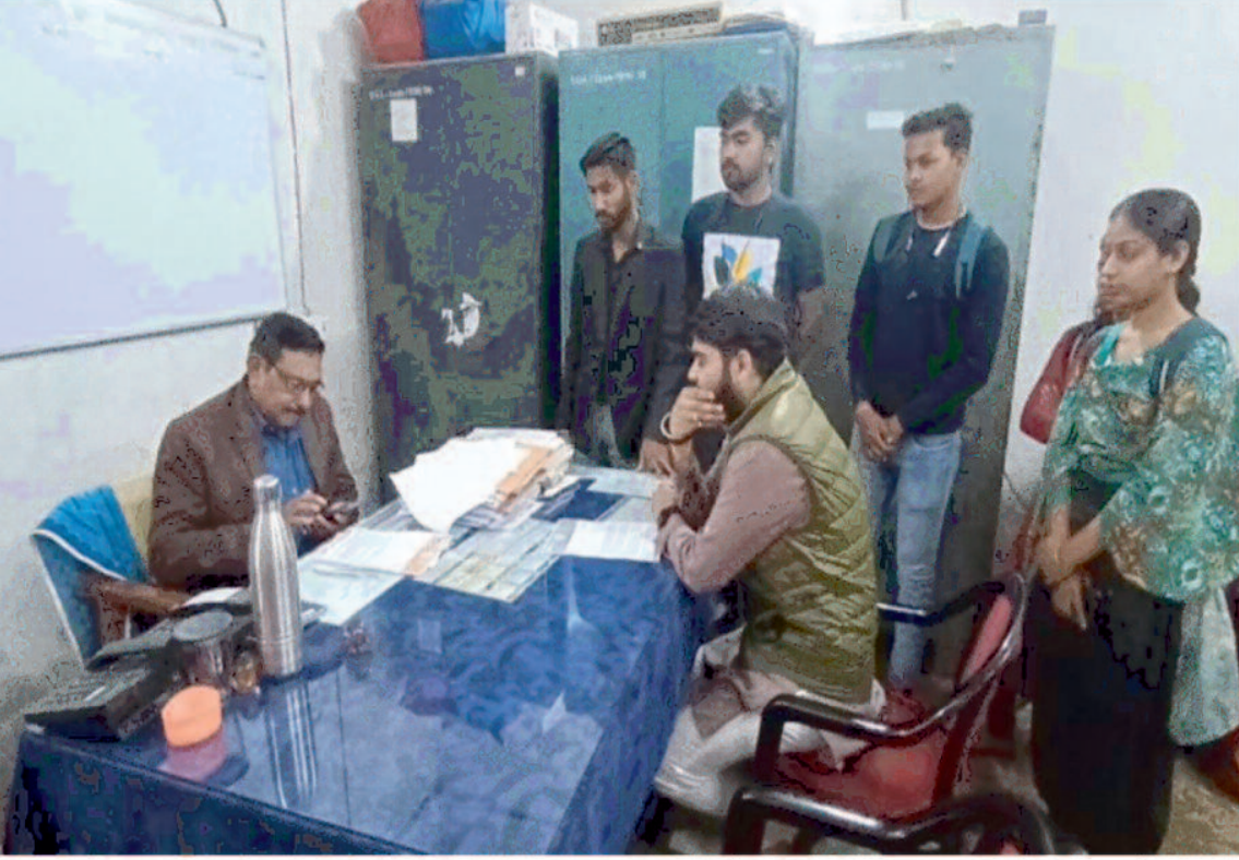
अंदर घोषित कर दिया जाएगा वहीं 4 मार्च को विश्वविद्यालय द्वारा परीक्षा फॉर्म का पोर्टल चालू रखा जाएगा जिससे छात्र अपना परीक्षा फॉर्म भर सकते हैं। वहीं को विश्वविद्यालय द्वारा परीक्षा फॉर्म का पोर्टल चालू रखा जाएगा जिससे छात्र लेकर मांग की जिसमें अप्रैल में बीएससी की लगातार परीक्षाएं आयोजित हो रही है बिना एक दिन के

गैर राजनीतिक दल आजाद सेवा संघ के प्रदेश सचिव व अन्य पदाधिकारियों द्वारा सोमवार को संत गहिरी गुरु विश्वविद्यालय में ज्ञापन सौंपा गया। जिसमें कई मुख्य मुद्दों पर कार्य करने की मांग की गई। सत्र 2022-23 की विश्वविद्यालय द्वारा परीक्षा आयोजित की गई थी जिसमें बहुत से छात्रों के अनुत्तीर्ण होने के पश्चात छात्रों ने सप्लीमेंट्री परीक्षा का फॉर्म भरा वहीं बहुत से छात्रों ने रिटोटलिंग का फॉर्म भरा परंतु आज की तारीख तक विश्वविद्यालय रिटोटलिंग का परिणाम जारी नहीं कर पाया है। जो की विश्वविद्यालय की ओर से बड़ी लापरवाही देखने को मिल रही है, जिसके कारण बहुत से छात्र ऐसे हैं जो परीक्षा फॉर्म 2023-24 सत्र का नहीं भर पाए हैं जिससे उन्हें परेशानी हो रही है। जिसको लेकर संघ ने मांग किया कि जल्द रिटोटलिंग का परिणाम जारी किया जाये वहीं एक दिन यानी की 4 मार्च को परीक्षा फॉर्म का पोर्टल खोलने के लिए भी कहा गया जिसपर विश्वविद्यालय द्वारा उचित आश्वासन देते हुए कहा गया की रिटोटलिंग का परिणाम दो-तीन दिन के