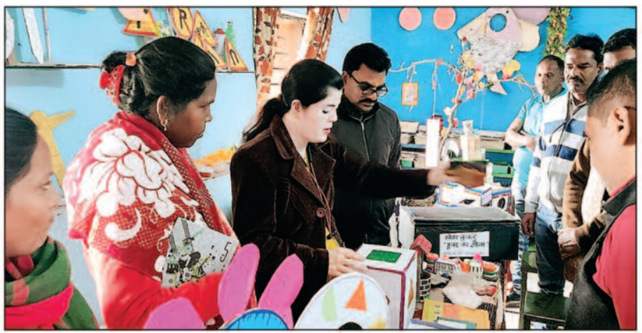
संवाददाता- बैकुण्ठपुर, 04 मार्च 2024 (घटती-घटना)।