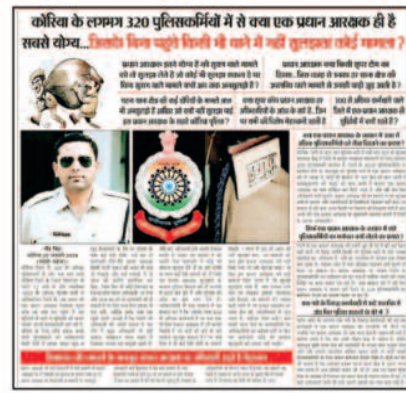
कोरिया के लगभग 320 पुलिसकर्मीयों में से क्या एक प्रमुख आरक्षक ही है सबसे कठोर... जिन्हें तब पट्टी पहिने से थाने में नहीं गुमनाम कोई रखना ?

नए पुलिस अधीक्षक को लापरवाह और नशेड़ी पुलिसकर्मीयों को लेकर भी कड़ा रुख अख्तियार करना होगा। नए पुलिस अधीक्षक को ऐसे पुलिसकर्मीयों की जानकारी लेनी होगी और उनके विरुद्ध कठोर कार्यवाही करनी होगी। कई पुलिसकर्मीयों जिले में नशे की हालत में भी कार्य पर उपस्थित रहते हैं। एक मामले में तो पटना आदर्श चौक में एक नशेड़ी पुलिसकर्मी ने टेली फोन से रात को वसूली करने की भी कोशिश की थी जिसमें ग्राम के लोगों ने उसे घेरा था और बाद में माफ़ी मांगकर वह वहां से बचकर जा सका था।