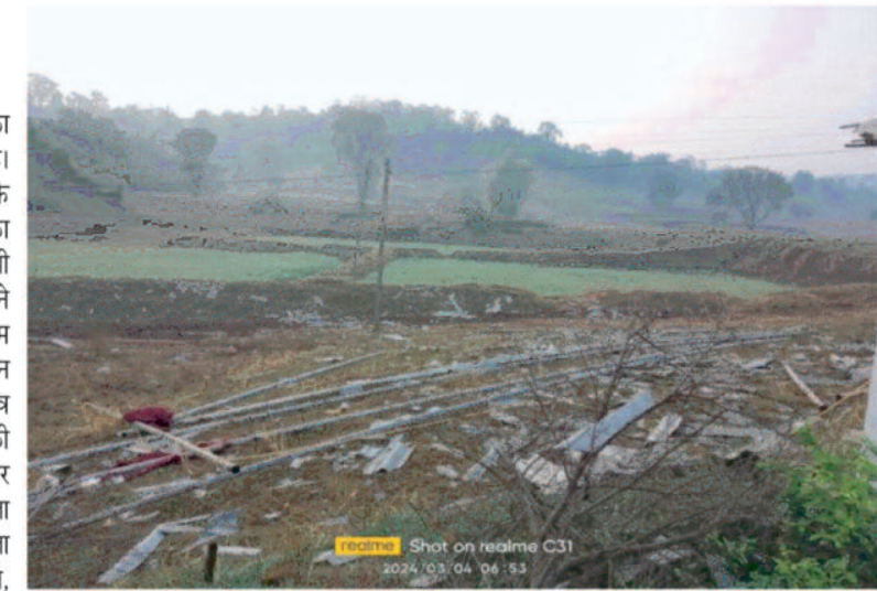
ग्रामीण सहमें रहे। घरों को नुकसान पहुंचने से गरीब परिवारों की परेशानी बढ़ गई है। तेज आंधी-तूफान के कारण सबसे ज्यादा नुकसान मैनापाट के ग्राम सुपलगा व पैगा में हुआ है। आंधी-तूफान में कई जगहों पर बिजली खंभा व तार टूट गए हैं। इससे तीन से चार मोहल्लों में अंधेरा छाए हुए हैं। वहीं विद्युत विभाग द्वारा मरम्मत शुरू करा दिया गया है। पर कई स्थानों पर तार टूटने व विद्युत खंभा गिरने से सोमवार की रात तक मरम्मत कार्य पूर्ण नहीं हो सका है।