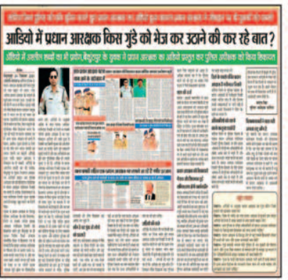
ज्यादियों में प्रदान आरक्षक किसा मुझे को भेज कर उठने को कर रहे बात ?

नए पुलिस अधीक्षक को लापरवाह और नशेड़ी पुलिसकर्मीयों को लेकर भी कड़ा रुख अख्तियार करना होगा। नए पुलिस अधीक्षक को ऐसे पुलिसकर्मीयों की जानकारी लेनी होगी और उनके विरुद्ध कठोर कार्यवाही करनी होगी। कई पुलिसकर्मीयों जिले में नशे की हालत में भी कार्य पर उपस्थित रहते हैं। एक मामले में तो पटना आदर्श चौक में एक नशेड़ी पुलिसकर्मी ने टेली फोन से रात को वसूली करने की भी कोशिश की थी जिसमें ग्राम के लोगों ने उसे घेरा था और बाद में माफ़ी मांगकर वह वहां से बचकर जा सका था।