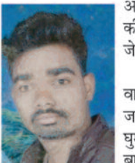
अरोपी 26 जनवरी को ऑक्सिजन पार्क से चोरी की थी। पुलिस ने आरोपी के खिलाफ कार्रवाई कर जेल दाखिल कर दिया है। पुलिस ने आरोपी के कब्जे से चोरी की बाइक भी बरामद की है। आरोपी 26 जनवरी को ऑक्सिजन पार्क से चोरी की थी। पुलिस ने आरोपी के खिलाफ कार्रवाई कर जेल दाखिल कर दिया है।

बाइक चोरी के मामले में पुलिस ने एक आरोपी को गिरफ्तार किया है। पुलिस ने आरोपी के कब्जे से चोरी की बाइक भी बरामद की है। आरोपी 26 जनवरी को ऑक्सिजन पार्क से चोरी की थी। पुलिस ने आरोपी के खिलाफ कार्रवाई कर जेल दाखिल कर दिया है। पुलिस ने आरोपी के कब्जे से चोरी की बाइक भी बरामद की है। आरोपी 26 जनवरी को ऑक्सिजन पार्क से चोरी की थी। पुलिस ने आरोपी के खिलाफ कार्रवाई कर जेल दाखिल कर दिया है।