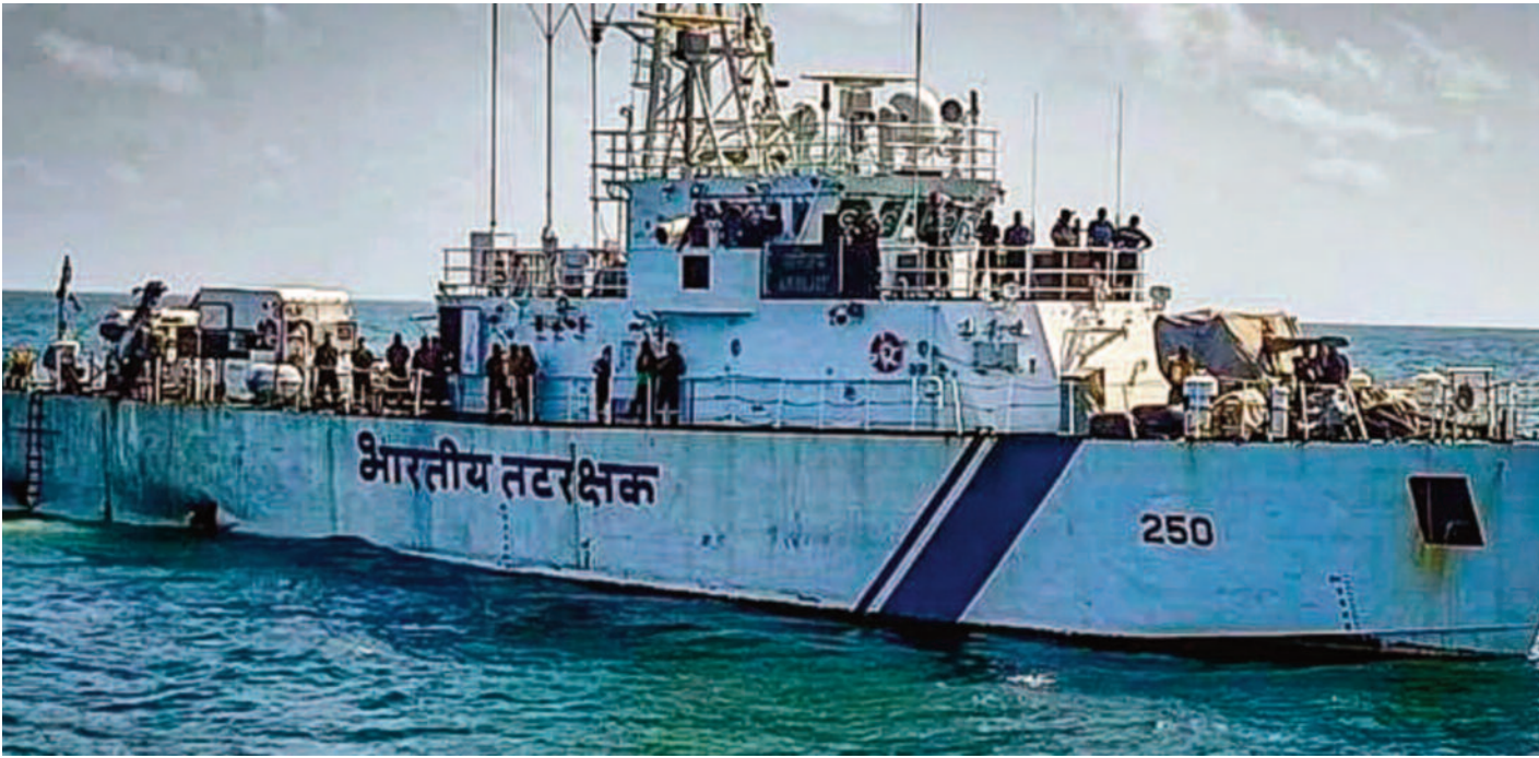
कर उसे जब्त किया। इसके लिए सेना की ओर से टीही विमानों की मदद ली गई और उसके कमांडो ने आपरेशन कर नौका पर मौजूद पांच लोगों को काबू में किया। नाव