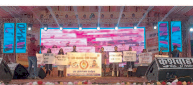
समझें और उनका पालन करें जिससे समाज सुंदर और बेहतर होगा। इस महत्वपूर्ण प्रस्तुति पर जिला प्रशासन द्वारा एनएसएस स्वयंसेवकों को स्मृति चिन्ह एवं प्रशस्ति प्रमाण पत्र प्रदान कर सम्मानित किया गया। महोत्सव में