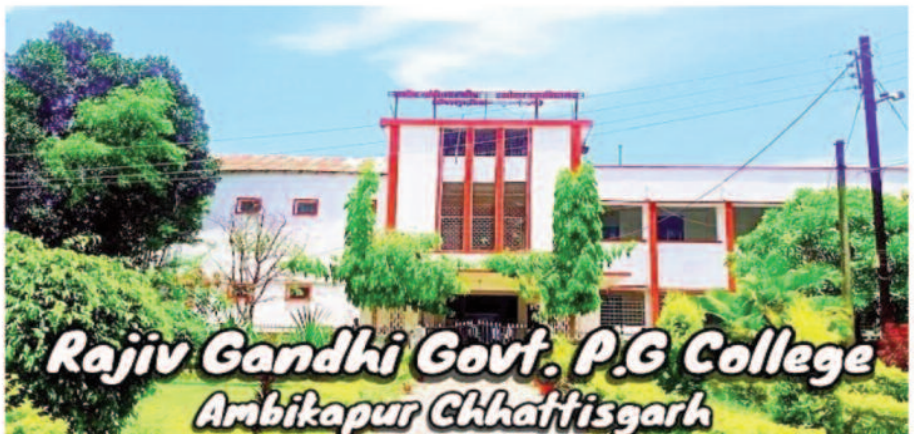
स्वर्णजयंती के आयोजन के समय भी अपने पूर्व छात्रों को सम्मान आमंत्रित किया था। महाविद्यालय के पूर्व छात्र प्रशासन, विज्ञान अनुसंधान एवं प्रौद्योगिकी, राजनीति, उच्च शिक्षा, विद्यालयीन शिक्षा, व्यापार, व्यवसाय उद्योग, एवं अनेकानेक पदों को सुशोभित कर रहे हैं, जो न सिर्फ हमारे देश में बल्कि विदेशों में भी ये कार्यरत हैं। महाविद्यालय अपने पूर्व छात्रों के लिए पूर्व छात्र सम्मेलन (एल्यूमिनी मीट) का आयोजन कर पूर्व छात्रों को एक प्लेटफॉर्म प्रदान करना चाहता है ताकि उनके छात्र जहां कहीं भी हैं अपने संस्था में उपस्थित होकर अपनी पुरानी यादें ताजा करें। बदलती परिस्थितियों में संस्था के विकास के विभिन्न आयामों को समझते हुए उसमें यथासंभव अपना

छत्तीसगढ़ राज्य के सुदूर उत्तरांचल में विस्तृत सरगुजा जिले के मुख्यालय के रूप में स्थित अम्बिकापुर का राजीव गांधी शासकीय स्नातकोत्तर महाविद्यालय अपनी स्थापना के 64 वर्ष पूर्ण कर चुका है। महाविद्यालय में प्रतिवर्ष लगभग 6 हजार छात्र-छात्राई अध्ययन करते हैं। महाविद्यालय में समाज विज्ञान, कला एवं मानविकी भौतिक एवम् जीवन विज्ञान, वाणिज्य, विधि तथा समाजमयिक कंप्यूटर विज्ञान व इलेक्ट्रॉनिक जैसे विषयों में पाठ्यक्रम संचालित होते हैं। यद्यपि समय-समय पर महाविद्यालय अपने पूर्व छात्रों को भी आमंत्रित करता रहा है। वर्ष 2010 में महाविद्यालय अपनी