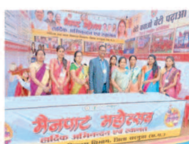
लैंगिक अपराध को समाज से पूर्णतः समाप्त करने व सामाजिक बदलाव हेतु प्रस्तुति दी गई। नाटक के अंत में अच्छे समाज के निर्माण के लिए हर व्यक्ति की जिम्मेदारी और कर्तव्य पर प्रेरित किया गया। बैनर, पोस्टर के माध्यम से लोगों को लैंगिक अपराधों के प्रति जागरूक करने जानकारी दी गई। सामाजिक बदलाव में समस्त नागरिकों की बहुत ही महत्वपूर्ण भूमिका है इसलिए सभी जिम्मेदार बनकर बाल संरक्षण और बाल अधिकार को