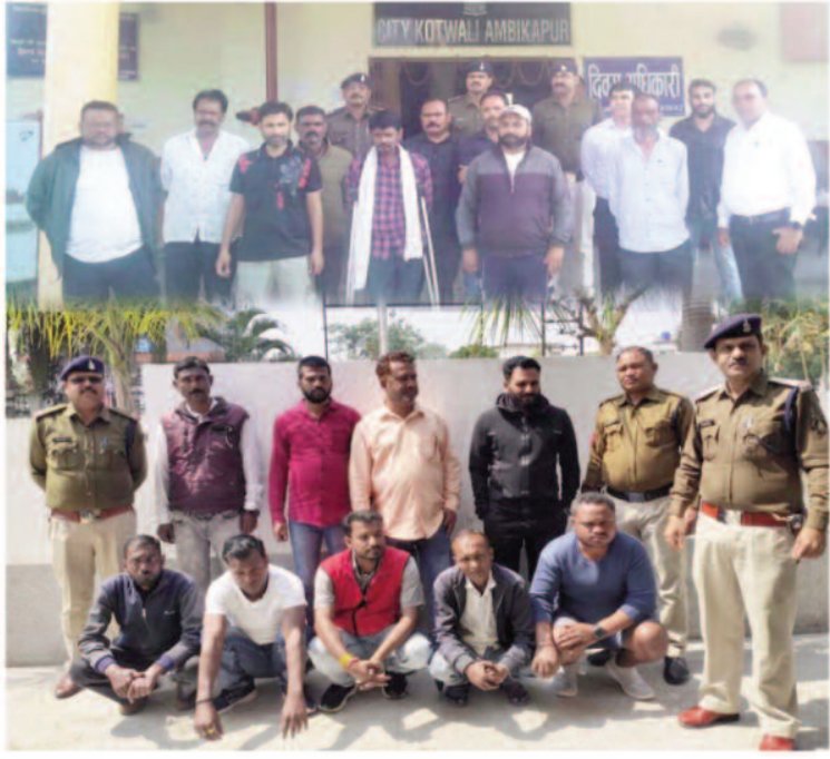
गए। पुलिस टीम द्वारा निगरानी एवं गुंडा बदमाशों को अपने-अपने निवास पर

वर्षों से आपराधिक गतिविधियों में शामिल रहने वाले लोगों की सूची तैयार कर पुलिस ने उन्हें थाने में तलब किया है। ताकि जिले में शांति व सुरक्षा व्यवस्था बनी रहे। एसपी ने जिले के सभी थाना व चौकी प्रभारियों को निर्देश दिए थे कि थाना क्षेत्र के गुंडा बदमाशों की सूची तैयार कर थाने में हारी लगवाई जाए। एसपी के निर्देश पर जिले के समस्त थाना व चौकी क्षेत्रों में निवासरत 23 निगरानी बदमाश व 57 गुंडा बदमाशों की हाजरी लगवाकर गुजर बसर चेक किया गया। इस दौरान पुलिस ने निगरानी एवं गुंडा बदमाशों के अद्यतन फोटोग्राफ एवं फिंगरप्रिंट लिए