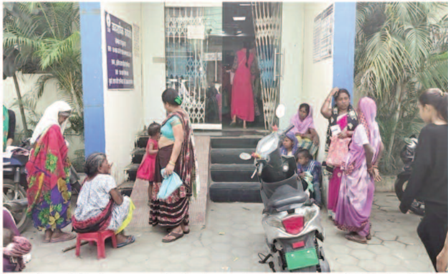
बैंक खातों में राशि का भुगतान हो सके। जिन हितग्राहियों के बैंक खाते आधार सीडिंग नहीं है अथवा उनका आधार नंबर अपडेट नहीं है। ऐसे महिलाएं बैंक पहुंचकर अपने खाते की जांच करा रहे हैं। इस लिए बैंकों में महिलाओं की भीड़ देखी जा रही है। अपने खाते को आधार से लिंक कराने व केवाईसी कराने महिलाओं को परेशानी का सामना करना पड़ रहा

महतारी वंदन योजना के राज्य सरकार ने प्रदेश के हर विवाहित महिलाओं को हर महीने 1 हजार रुपए देने की घोषणा की है। इसके लिए आवेदन प्रक्रिया अंतिम चरण में है। महिला दिवस के अवसर पर 8 मार्च को महिलाओं के खाते में भुगतान किया जाना है। इसे लेकर महिलाओं में उत्साह है। वहीं कई ऐसी महिलाएं हैं जिनका आवेदन रिजेक्ट कर दिया गया है उनके चेहरे पर मायूसी भी देखी जा रही है। नेशनल पेमेंट्स कॉरपोरेशन ऑफ इंडिया से महिलाओं के खाते का जांच कराया जा रहा है। जिसमें कई महिलाओं के बैंक खाते की जानकारी में आधार सीडिंग का मिलान नहीं हो रहा है। हितग्राहियों से त्वरित रूप से बैंकों के माध्यम से आधार सीडिंग अपडेट करने की अपील की गई है। ताकि निर्धारित तिथि को उनके आधार सीडिंग