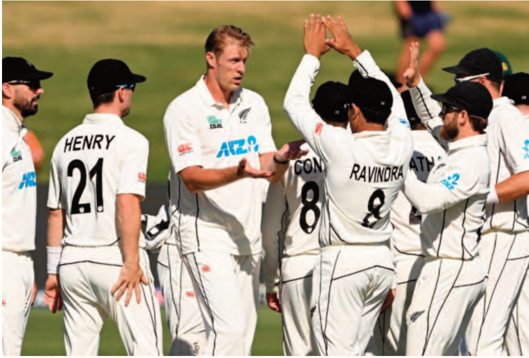
अपने नाम कर लिया। इससे पहले यह रिकॉर्ड स्टीव स्मिथ के नाम था। स्मिथ ने 174 पारियों में ऐसा किया था।

केन विलियमसन ने मैच की दूसरी पारी में नाबाद 133 रन की पारी खेली। 260 बॉल की पारी में उन्होंने 12 चौके और दो छक्के लगाए। विलियमसन का 32वां टेस्ट शतक सिर्फ 172 पारियों में आया। इसी के साथ उन्होंने टेस्ट क्रिकेट में सबसे कम पारियों में 32 शतक लगाने का रिकॉर्ड