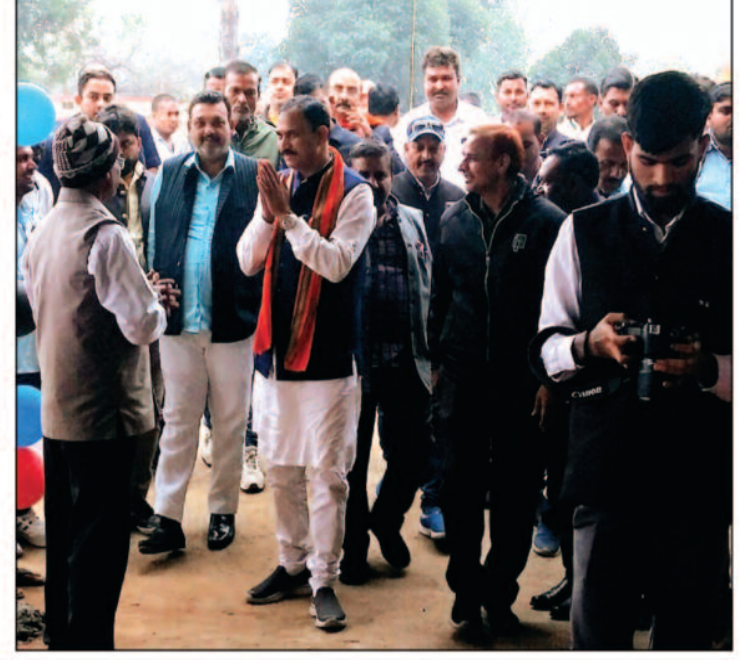
कार्यकर्ता पदाधिकारी भी उपस्थित हुए थे उन सभी को शुभकामनाएं दी।

कार्यालय की शुरुआत की गई है। कार्यालय का उद्घाटन होते ही मंत्री जी के पास स्थानीय एवं ग्रामीण क्षेत्रों से आए ग्रामीण अपनी समस्याओं के आवेदन लेकर पहुंच गए और मंत्री जी ने लोगों से घिर होने के बाद भी एक एक व्यक्ति के आवेदन को बड़े सरल और सहज तरीके से पढ़कर समझ कर