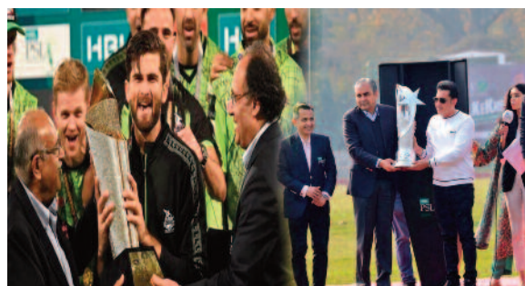
प्रीमियर लीग, आईएलटी 20 और एएसएल 20 लीग में खेलने का फैसला कर रहे हैं। इससे उनकी फेंचबाजी को काफी नुकसान

करांची, 13 फरवरी 2024। पाकिस्तान की लीग यानी पाकिस्तान सुपर लीग से कई अंतरराष्ट्रीय खिलाड़ियों ने नाम वापस ले लिए हैं। इतना ही नहीं कई क्रिकेट बोर्ड अपने खिलाड़ियों को इस लीग में भाग लेने की अनुमति देने से इनकार कर रहे हैं। पीएसएल 17 फरवरी से लाहौर में शुरू होने वाला है। कुछ मीडिया रिपोर्ट्स के मुताबिक, पीएसएल की सभी 6 टीमों इस बात से नाराज हैं कि विदेशी खिलाड़ी बांग्लादेश