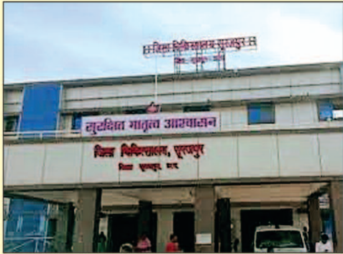
सुविधा न मिलने निजी क्लिनिकों में भेजने की शिकायत एक मरीज के द्वारा

मिली जानकारी के अनुसार जिला चिकित्सालय में जीवन दीप समिति के बैठक लेने कलेक्टर रोहित व्यास पहुंचे थे तभी जिला चिकित्सालय में जांच का