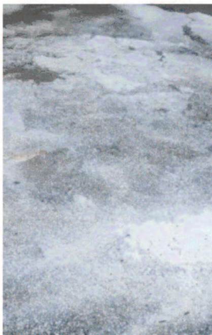
कई जगहों पर तेज हवा के साथ बारिश इसके साथ ही शनिवार को देर रात

बना हुआ है। इन दोनों प्रभाव के कारण उत्तरी छत्तीसगढ़ में इसका असर देखा जा रहा है। रविवार की सुबह से ही मौसम का मिजाज बदला हुआ है। सुबह अम्बिकापुर सहित कई क्षेत्रों में घने बादल व तेज हवा चलने से मौसम शुष्क रहा। सुबह-सुबह बूदाबांदी हुई। इसके बाद पुनः दोपहर में अचानक मौसम ने करवट बदल ली और तेज हवा के साथ बारिश हुई। इसके बाद मौसम का लुकाछिपी का खेल चलता रहा। पुनः चार बजे के बाद तेज हवा के साथ बारिश हुई। बारिश व ओलावृष्टि के कारण मौसम ठंड रहा। अम्बिकापुर सहित उत्तरी छत्तीसगढ़ में मौसम का मिजाज बदला हुआ है। रविवार को