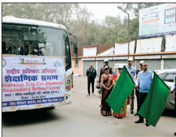
-संवाददाता- कोरबा, 01 फरवरी 2024 (घटती-घटना)।