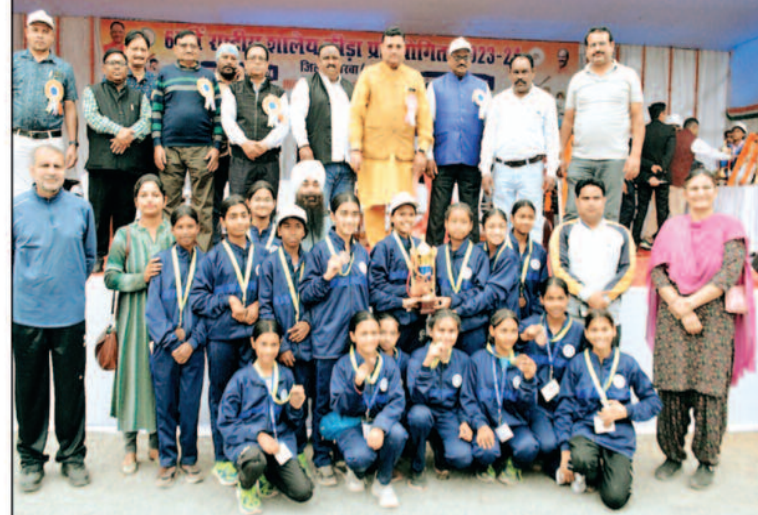
-संवाददाता- कोरबा, 01 फरवरी 2024 (घटती-घटना)।