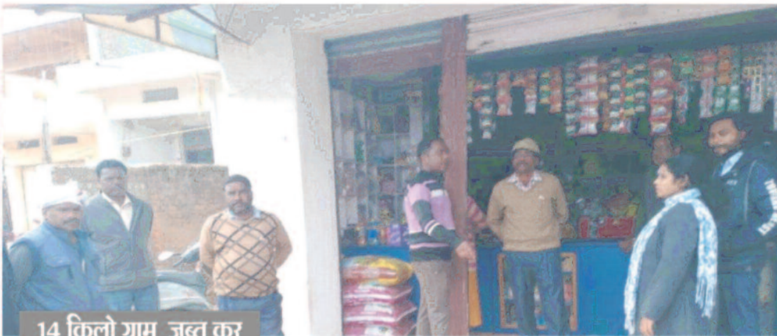
14 किलो ग्राम जव्त कर जुमाना 75 हजार लगाया

- संवाददाता - कुसमी, 01 फरवरी 2024 (घटती-घटना)।