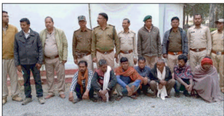
दिया था। मुखबियों की सूचना के बाद वन विभाग को इसका पता चला था और गुप्तों को