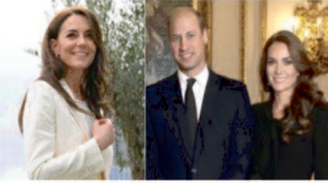
42 साल की राजकुमारी के समी कार्यक्रम रद्द

लंदन, 29 जनवरी 2024। लंदन के अस्पताल में सफल सर्जरी के बाद केट मिडलटन को छुट्टी मिल गई है। ब्रिटेन के शाही परिवार की बहू केट मिडलटन को प्रिंसेज ऑफ वेल्स यानी राजघराने के तहत गिने जाने वाले वेल्स में राजकुमारी का ओहदा हासिल है। 16 जनवरी को अस्पताल में केट को पेट से जुड़ी बीमारी के कारण सर्जरी हुई। अब 29 जनवरी को उन्हें अस्पताल से डिस्चार्ज कर दिया गया। सेहत को लेकर जारी आधिकारिक अपडेट के मुताबिक वेल्स की राजकुमारी को कैंसर होने का खतरा था, लेकिन फिलहाल इस ऑपरेशन के बाद यह चिंता टल गई है।