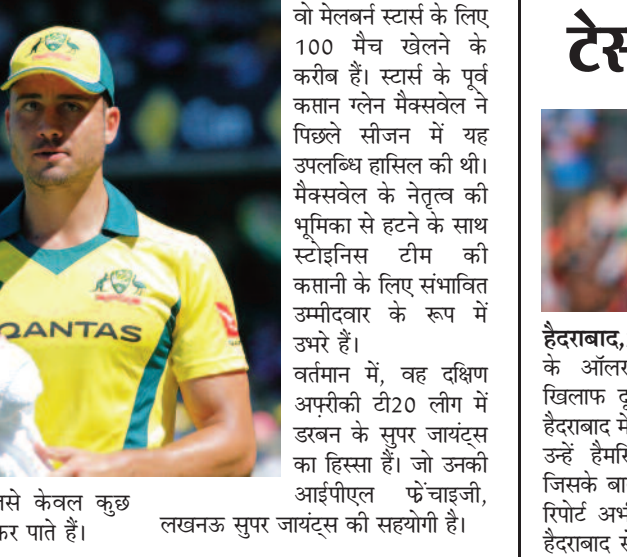
रिकॉर्ड के करीब हैं जिसे केवल कुछ चुनिंद लोग ही हासिल कर पाते हैं। लखनऊ सुपर जायंट्स की सहयोगी है।

केप टाउन, 29 जनवरी 2024। ऑस्ट्रेलिया के स्टार ऑलराउंडर मार्क्स स्टोइनिंस ने बिग बैश लीग (बीबीएल) में मेलबर्न स्टार्स के साथ अपना अनुबंध तीन साल तक बढ़ा दिया है। यानी वो अब 2026-27 तक स्टार्स से जुड़े रहेंगे। मार्क्स स्टोइनिंस का मेलबर्न स्टार्स के साथ बने रहने का निर्णय सर्वप्रथम था। कई क्लबों ने इस खिलाड़ी को अपने साथ जोड़ने में रुचि व्यक्त की थी। पर्य स्कोर्स स्टोइनिंस की प्रारंभिक बीबीएल टीम थी जहां उन्होंने 2012-13 सीजन में तीन मैच खेले थे। उन्हें फिर से अपने साथ शामिल करना चाहती थी। हालांकि, स्टोइनिंस ने स्टार्स के साथ अपनी यात्रा जारी रखने का फैसला किया। स्टार्स के प्रति उनकी प्रतिबद्धता किसी से छिपी नहीं है। स्टोइनिंस एक बड़े