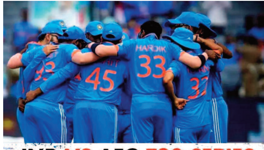
IND VS AFG T20 SERIES

टीम में अपनी जगह पकड़ कर सकें। इससे पहले भारत ने मोहाली में खेले गए पहले मैच में 6 विकेट से जीत दर्ज करके तीन मैच की श्रृंखला में 1-0 से बढ़त बनाई। ऐसे में जितेश शर्मा, वाशिंगटन सुंदर और अक्षर पटेल जैसे खिलाड़ियों के लिए यह अनिवार्य हो गया है कि वह अफगानिस्तान के खिलाफ अच्छा प्रदर्शन करके चयनकर्ताओं की नजर में बने रहें जिनका लक्ष्य टी20 विश्व कप के लिए अदद टीम का चयन करना है। भारतीय टीम को जून में होने वाले विश्व कप से पहले कोई अन्य टी20 सीरीज नहीं खेनी है और ऐसे में अफगानिस्तान के खिलाफ प्रदर्शन काफी मायने रखता है। जितेश ने ईशान किशन को पीछे छोड़कर विकेटकीपर बल्लेबाज की दौड़ में खुद को आगे कर दिया है। अफगानिस्तान के खिलाफ अच्छा प्रदर्शन करके चयनकर्ताओं की नजर में बने रहें जिनका लक्ष्य टी20 विश्व कप के लिए अदद टीम का चयन करना है। भारतीय टीम को जून में होने वाले विश्व कप से पहले कोई अन्य टी20 सीरीज नहीं खेनी है और ऐसे में अफगानिस्तान के खिलाफ प्रदर्शन काफी मायने रखता है। जितेश ने ईशान किशन को पीछे छोड़कर विकेटकीपर बल्लेबाज की दौड़ में खुद को आगे कर दिया है। अफगानिस्तान के खिलाफ अच्छा प्रदर्शन करके चयनकर्ताओं की नजर में बने रहें जिनका लक्ष्य टी20 विश्व कप के लिए अदद टीम का चयन करना है। भारतीय टीम को जून में होने वाले विश्व कप से पहले कोई अन्य टी20 सीरीज नहीं खेनी है और ऐसे में अफगानिस्तान के खिलाफ प्रदर्शन काफी मायने रखता है।