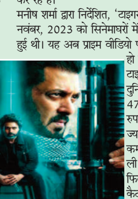
कर रहे हैं। मनीष शर्मा द्वारा निर्देशित, 'टाइगर 3' 12 नवंबर, 2023 को सिनेमाघरों में रिलीज हुई थी। यह अब प्राइम वीडियो पर स्ट्रीम हो रही है। टाइगर 3 ने दुनिया भर में 472 करोड़ रुपये से ज्यादा की कमाई कर ली है। फिल्म में कैटरीना कैफ और इमरान खान भी हैं। दिलचस्प बात यह है कि इसमें शाहरुख खान की कैमियो भूमिका और त्रिक रेशन का एक पोस्ट-क्रैडिट दृश्य भी है। पिछली दो किस्तों डू एक था टाइगर और टाइगर जिंदा है की तरह डू यह फिल्म रॉ एजेंट टाइगर (सलमान) और आईएसआई एजेंट जोया (कैटरीना) से जुड़े एक नए मिशन पर केंद्रित है। सलमान के आगामी प्रोजेक्ट्स की बात करें तो उन्होंने अभी तक अपनी नई फिल्म की घोषणा नहीं की है। हालांकि, रिपोर्ट्स के मुताबिक, वह 'द बुल' नाम की एक फिल्म में काम कर सकते हैं।

बॉक्स ऑफिस पर सफल प्रदर्शन करने के बाद, सलमान खान-स्टार 'टाइगर 3' अब डिजिटल प्लेटफॉर्म पर अच्छा प्रदर्शन कर रही है। फिल्म को दर्शकों से मिल रहे प्यार को देखकर सलमान ने कहा, टाइगर फ्रेंचाइजी को पहली फिल्म से ही जबरदस्त प्यार मिला है, चाहे वह नाटकिय रूप से हो, सैटेलाइट पर या स्ट्रीमिंग पर! इसलिए, यह देखा आश्चर्यजनक लगता है कि तीसरी फिल्म कैसी है। टाइगर 3 की किस्त पहले सिनेमाघरों में और अब स्ट्रीमिंग पर हिट रही। उन्होंने आगे कहा, मैं अपने सोशल मीडिया के माध्यम से अपने दर्शकों के साथ निकट संपर्क में हूँ और अब टाइगर 3 के ओटीपी पर आने के बाद मैं प्यार का प्रवाह देख सकता हूँ। एक अभिनेता के रूप में, मेरा सबसे बड़ा और एकमात्र काम लोगों का भरपूर मनोरंजन करना है और मैं मुझे खुशी है कि टाइगर 3 को दुनिया भर के लोग पसंद