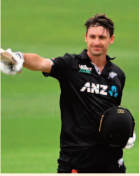
यंग हैमिल्टन के सेर्डन पार्क में रविवार को होने वाले सीरीज के दूसरे मैच के बाद टीम में शामिल होंगे। टीमों सोमवार को हैमिल्टन से डुनेडिन जाएंगी।

वेलिंगटन, 13 जनवरी 2024। कंधे की चोट के कारण बाहर होने के बाद जोश क्लार्कसन अब पाकिस्तान के खिलाफ टी20 सीरीज के तीसरे मैच में न्यूजीलैंड की टीम में शामिल नहीं होंगे। एनजेडसी ने एक बयान में कहा कि सुपर स्मैश में सेंट्रल स्टैग्स के लिए खेलते हुए क्लार्कसन को लगी चोट के कारण विल यंग अब डुनेडिन यूनिवर्सिटी ऑफ ओटगो ओवल में होने वाले मैच की तैयारी के लिए टीम में शामिल होंगे। क्लार्कसन तीसरे मैच के लिए कप्तान केन विलियमसन की जगह टीम में शामिल होने वाले थे जो घुटने में चोट के बाद नहीं खेल सकेंगे।