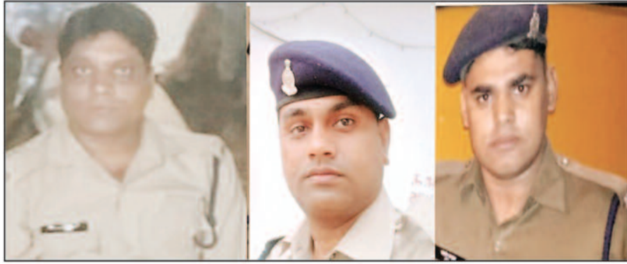
था की एमसीबी जिले के कुछ निरीक्षण उपरांत वापस लौटते ही चर्चित प्रधान आरक्षक और आरक्षक का आईजी सरगुजा ने स्थानांतरण कर दिया था और यह आधार पर किया गया था जिसके अनुसार उनकी कोई जूटि पाई गई थी या जिनकी कार्यशैली को लेकर कोई

एमसीबी जिले से स्थानांतरित किए गए तीन पुलिसकर्मी आज तक अपनी नवीन पदस्थली पर नहीं पहुंच सके हैं, उन्होंने एमसीबी जिले से तो रवानगी ले ली है लेकिन वह अपनी आमद देने नवीन पदस्थापना जिले में नहीं पहुंचे हैं चिकित्सा अवकाश लेकर वह अपने स्थानांतरण आदेश में संशोधन चाहते हैं ऐसा बताया जा रहा है। जैसा की पहले भी खबरों के माध्यम से इस विषय पर अवगत कराया गया