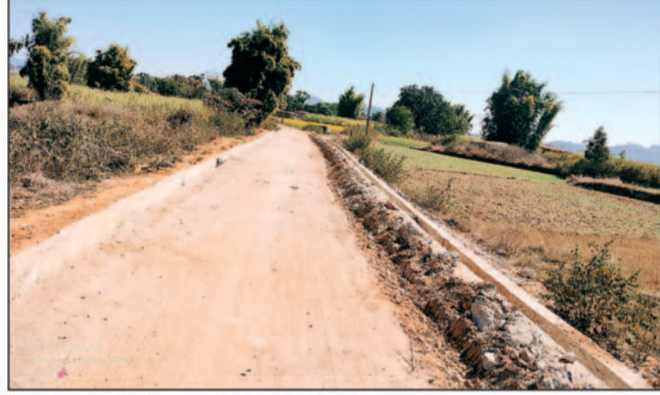
डैमेज हो चुका है जो भविष्य में भी बनने की संभावनाएं नहीं लग रही। जबकि ठेकेदार को सड़क को खोदकर पाइपलाइन बिछाने के बाद इसका मेंटेनेंस भी करना था

जल जीवन मिशन के अंतर्गत प्रतापपुर विधानसभा क्षेत्र में पाइप लाइन खली जा रही है, पाइप डाला जाना पूरे विधानसभा क्षेत्र के लिए मुसीबत बन गया है। सड़कें पाइप लाइन खलने के लिए उजाड़ दी गई हैं, यह कारनामा पीएचई के ठेकेदार द्वारा किया गया। मिली जानकारी के अनुसार जनपद पंचायत प्रतापपुर के अंतर्गत ग्राम पंचायत दरहोरा में पीएचई विभाग द्वारा नल जल योजना के तहत पाइपलाइन बिछाने का कार्य किया जा रहा है। जिसमें अभी हाल ही में बने सीसी रोड को ड्रिल मशीन व जेसीबी मशीन से खोदकर क्षतिग्रस्त कर दिया गया एवं पाइप लाइन बिछा दिया गया है। रोड कई जगह से