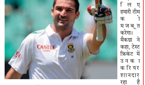
सीजन के लिए हमारी टीम को मजबूत करेगा। मैं एल्गर ने कहा, टेस्ट क्रिकेट में उनका करियर शानदार रहा है और मैं वास्तव में दुनिया के सामने उच्चतम स्तर पर नवाने की अपनी इच्छा का प्रदर्शन किया है। अंतरराष्ट्रीय क्षेत्र में उनकी उपलब्धियाँ उनकी क्षमताओं के बारे में बहुत कुछ बताती हैं और हम एसेक्स में उनके प्रभाव को देखने के लिए उत्साहित हैं।

नई दिल्ली, 13 जनवरी 2024। दक्षिण अफ्रीका के पूर्व बल्लेबाज डीन एल्गर ने 2024 काउंटी सीजन से पहले एसेक्स के साथ तीन साल का करार किया है। एल्गर ने हाल ही में भारत के खिलाफ दो मैचों की टेस्ट सीरीज के बाद अंतर्राष्ट्रीय क्रिकेट से संन्यास ले लिया था। 36 वर्षीय एल्गर एसेक्स में शामिल होकर बहुत खुश हैं। एल्गर को यह कहते हुए उद्धृत किया गया, मैं एसेक्स के साथ अपनी क्रिकेट यात्रा के इस नए अध्याय को शुरू करने के लिए रोमांचित हूँ। क्लब हाल के वर्षों में समान के लिए प्रयास कर रहा है, और मैं आगे की सफलता में योगदान देने के लिए उत्सुक हूँ। उन्होंने कहा, मैंने काउंटी क्रिकेट में अपने पिछले अनुभवों का भरपूर