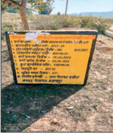
ग्राम पंचायत दरहोरा में ग्रामीणों के आवागमन के लिए 4 लाख रूपए की लागत से सीसी रोड का निर्माण अभी हाल ही में नवीन निर्माण कराया गया था। परन्तु

पीएचई विभाग के ठेकेदार ने रोड के बीचों बीच खोदकर जीर्णोद्धार स्थिति में कर दिया। जबकि कार्य पूर्ण हो जाने उपरांत रोड को ठेकेदार द्वारा दुरुस्त करना था लेकिन कार्य पूर्ण उपरांत ठेकेदार नौ दो ग्यारह हो गया। उखड़े पड़े सीसी रोड को आज तक दुरुस्त नहीं किया जा सका है जिससे ग्रामीणों को काफी परेशानियों का सामना करना पड़ रहा है। इस समस्या को लेकर लोगों में आक्रोश है, ग्रामीणों ने कहा है कि अगर यह कार्य जल्द ही नहीं कराया जाता है तो लोग आंदोलन करने को बाध्य होंगे। जिसकी संपूर्ण जिम्मेदारी पीएचई विभाग की होगी। स्थानीय ग्रामीणों ने जिला प्रशासन से ठेकेदार के ऊपर कार्रवाई करते हुए तत्काल सीसी रोड की मरम्मत करने की मांग की है।