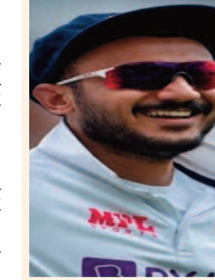
जुरेल को भी 16 खिलाड़ियों की टीम में मिली जगह