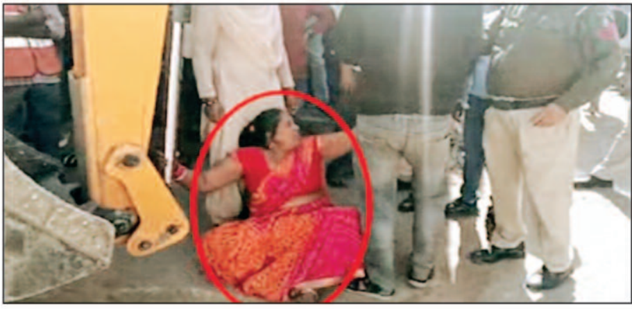
व्यवस्था प्रभावित हो रही थी लिहाजा नगर निगम की टीम शनिवार को बुधवारी पहुंची कार्रवाई करते हुए सव्जी विक्रेताओं को बाजार के भीतर भेज दिया। मुख्य सड़क के किनारे सव्जी दुकान लगाकर यातायात व्यवस्था को प्रभावित करने वाले सव्जी विक्रेताओं को नगर निगम की टीम ने बुधवारी बाजार के भीतर व्यवस्थित कर दिया है। नगर निगम के पास पिछले लंबे

कोरबा शहर के वीआईपी मुख्य मार्ग बुधवारी बाजार और आसपास मुख्य सड़क के किनारे अतिक्रमण कर दुकानदारी लगाने वाले सव्जी विक्रेताओं पर नगर निगम और पुलिस की टीम संयुक्त कार्रवाई करने पहुंची जहां उन्हें शुरु में काफी विरोध का सामना करना पड़ा। बुधवारी मुख्य मार्ग पर कार्रवाई के दौरान एक महिला ने जमकर हंगामा मचाया। घर के बाहर अतिरिक्त अतिक्रमण कर दुकान बनाया जा रहा था जिसे तोड़ दस्तक टीम तोड़ने पहुंची हुई थी जहां महिला जेसीबी मशीन के नीचे बैठ गई। महिला का तमाशा घंटों तक चलता रहा। महिला पुलिस स्टाफ को बुलाकर उसे हटाय गया और अतिक्रमण हटाय गया। इसके बाद नगर निगम की टीम बुधवारी बाजार कार्रवाई करने पहुंची। सव्जी विक्रेताओं के कारण यातायात