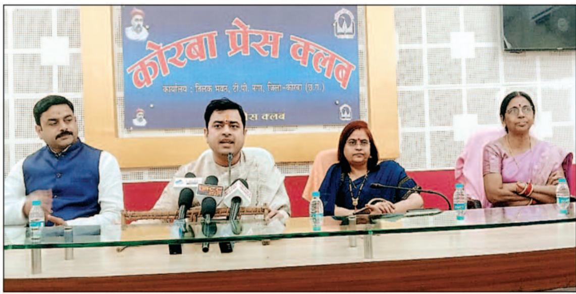
-संवाददाता- कोरबा 05 जनवरी 2024 (घटती-घटना)।