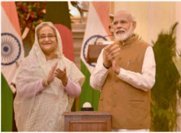
दौरान भारत विरोधी तत्वों को बांग्लादेश में बढ़ावा दिया गया। हमने