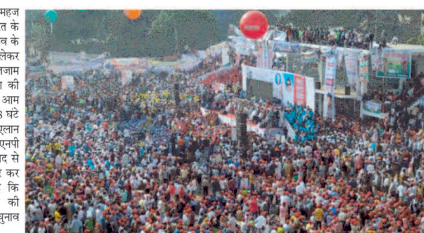
पूर्व प्रधानमंत्री खालिदा जिया की

हाका, 04 जनवरी 2024। महज दो दिन बाद सात जनवरी को भारत के पड़ोसी देश बांग्लादेश में आम चुनाव के लिए मतदान होगा, जिसको लेकर सशस्त्र बलों ने सुरक्षा के पुख्ता इंतजाम किए हुए हैं। इसी बीच बांग्लादेश की प्रमुख विपक्षी पार्टी बीएनपी ने आम चुनाव के विरोध में गुरुवार को 48 घंटे की देशव्यापी आम हड़ताल का एलान किया है। गौरतलब है कि बीएनपी चुनावी तारीखों की घोषणा के बाद से ही इन आम चुनावों का बहिष्कार कर रही है। बीएनपी का आरोप है कि मौजूदा प्रधानमंत्री शेख हसीना की मौजूदगी में देशभर में निष्पक्ष चुनाव नहीं हो सकते हैं। चुनाव के लिए गठित हो गए पार्टी तटस्थ सरकार- बीएनपी