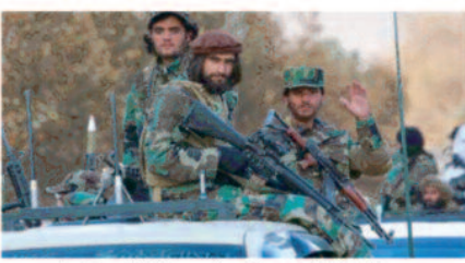
एंड सिक्वोरिटी स्टडीज ने एक रिपोर्ट में कहा कि देश की सुरक्षा स्थिति 2014 जैसी ही है।

पर भी चर्चा की गई है। विदेश कार्यालय के एक बयान के मुताबिक, जिलानी ने अफगानिस्तान के साथ निरंतर जुड़ाव और पारस्परिक रूप से लाभप्रद संबंधों के लिए पाकिस्तान की प्रतिबद्धता की पुष्टि की। उन्होंने क्षेत्रीय व्यापार और कनेक्टिविटी की पूरी क्षमता का उपयोग करने के लिए चिंता के सभी मुद्दों को संबोधित करने के महत्व को भी रेखांकित किया। पाकिस्तान इंस्टीट्यूट फॉर कॉन्फ्लिक्ट