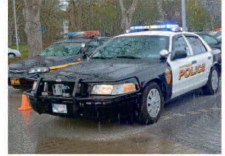
अब तक पुष्टि नहीं हो पाई है। बता दें कि पेरी उत्तरी रेकून नदी के किनारे डलास काउंटी, आयोवा प्रांत का एक शहर है।

वॉशिंगटन, 04 जनवरी 2024। संयुक्त राज्य अमेरिका से एक बार