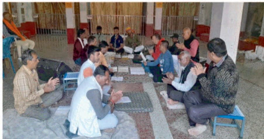
संदेश दिया कि 22 जनवरी को श्री रामलला के प्राण प्रतिष्ठा के दिन अपने घरों में मौजूद पूजा स्थलों पर

प्रदेश कांग्रेस कमेटी के आवाहन पर जिला कांग्रेस कमेटी ने आज राम मंदिर, अम्बिकापुर में सुंदरकांड और हनुमान चालीसा का पाठ हुआ। भक्तों का उत्साह देखकर प्रभु श्री राम की भक्ति में आम नागरिकों ने भी अपनी सहभागिता दी। राममंदिर परिसर में पवन-पुत्र मानस मंडल के साथ रविवार दोपहरन यह आयोजन हुआ जो 11 बजे से लेकर 3 बजे तक जारी रहा। इस दौरान कांग्रेस कार्यकर्ताओं ने आमजनों से मुलाकात कर उन्हें पार्टी की ओर से