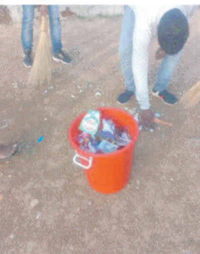
स्थलों को साफ सुथरा रखने, स्वच्छता से जुड़े बिमारीयों को नियंत्रित करने तथा स्वच्छता के महत्व को समझने एवं उससे होने वाले लाभ की प्रेरणा मिली, व्यक्तिगत शौचालय का उपयोग सुनिश्चित कराने हेतु स्नेच्छाशालीयों द्वारा घर-घर ग्रामवासीयों से संपर्क कर उन्हें प्रेरित किया जा रहा है।