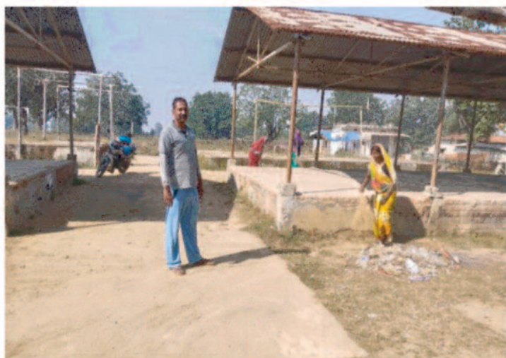
आंगनवाड़ी कार्यकर्ता, महिला स्व सहायता समूहों ने बड़ चढ़ के हिस्सा लिया। इस स्वच्छता एवं जागरूकता कार्यक्रम अभियान से ग्रामीणजनों को सार्वजनिक