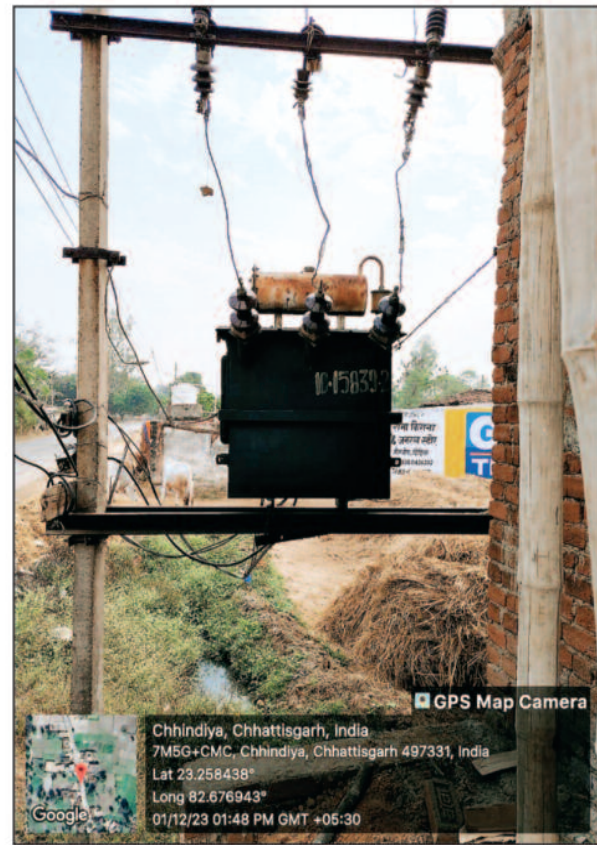
शिकायत के बाद भी विभाग उदासीन, अभी तक कोई कार्यवाही नहीं

-रवि सिंह- कोरिया, 02 दिसंबर 2023 (घटती-घटना)।