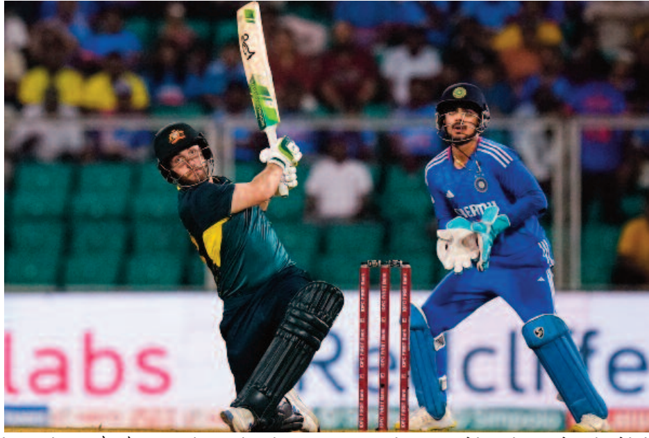
नेटिम डेविड और मैथ्यू शॉर्ट के विकेट लेकर प्रभाव डाला, लेकिन उन्होंने अपने चार ओवर के कोटे में

अहम होगी। अय्यर ने वनडे विश्व कप में शानदार प्रदर्शन किया था लेकिन ऑस्ट्रेलिया के खिलाफ रायपुर में शुक्रवार को उन्होंने पिछले एक साल से भी अधिक समय में अपना पहला टी20 अंतरराष्ट्रीय मैच खेला। इस मैच में उन्होंने सात गेंद का सामना करके आठ रन बनाए जिनमें कोई बाउंड्री शामिल नहीं है। इसलिए दक्षिण अफ्रीका जाने से पहले अय्यर चिन्नास्वामी स्टेडियम में बड़ी पारी खेलने की कोशिश करेंगे। उन्होंने कुछ दिन पहले ही वनडे विश्व कप में इस मैदान पर नीदरलैंड के खिलाफ शतक लगाया था। अय्यर की तरह चाहर ने भी चोटिल होने के कारण लंबे समय तक बाहर रहने के बाद वापसी की है। रायपुर में खेला गया मैच उनका टी20 प्रारूप में भारत की तरफ से पिछले साल अक्टूबर के बाद पहला मैच था। इस 31 वर्षीय तेज गेंदबाज