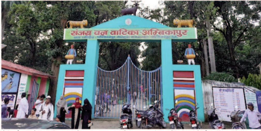
रहेगी। लोग अपने दिन की शुरुआत देव महामाया मंदिर, देवी मंदिर, साई मंदिर में दर्शन के साथ करेंगे। इससे शहर के लोग दर्शन करने पहुंचेंगे। वहीं मुस्लिम समाज के लोग मस्जिद व ईसाई समाज के लोग गिरजाघरों में प्रार्थना कर नए साल की

इसके लिए पुलिस की टीम तैयारी कर रखी है। बीते वर्ष 2023 को विदा कर वर्ष 2024 के स्वागत को लेकर शहर से लेकर गांव तक लोग अपने-अपने तरीके से जश्न में डूबे हुए हैं। साल के आखिरी दिन पिकनिक स्पॉट्स पर लोगों की भीड़ देखने को मिली। वहीं शहर में भी युवाओं ने केक काटकर व अन्य कार्यक्रमों के जरिए नए साल का स्वागत पूरे उत्साह के साथ किया। साल के आखिरी दिन जैसे-जैसे शाम ढलती गई, लोगों का उत्साह बढ़ता ही गया। विशेषकर युवा नए साल के स्वागत में अपनी ही धुन में नजर आए। वहीं नए वर्ष पर सरगुजा पुलिस भी पूरी तरह से तैयार है। किसी प्रकार को कोई व्यवधान उत्पन्न न हो इसके लिए शहर के 17 स्थानों को चिन्हित किया गया है। जहां पुलिस बल तैनात रहेगी। सोमवार को नए साल के पहले दिन गार्डन्स के साथ ही मंदिरों में भीड़